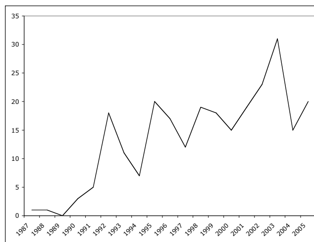
Figure 2 : Articles du Monde faisant état d'un « repli identitaire »