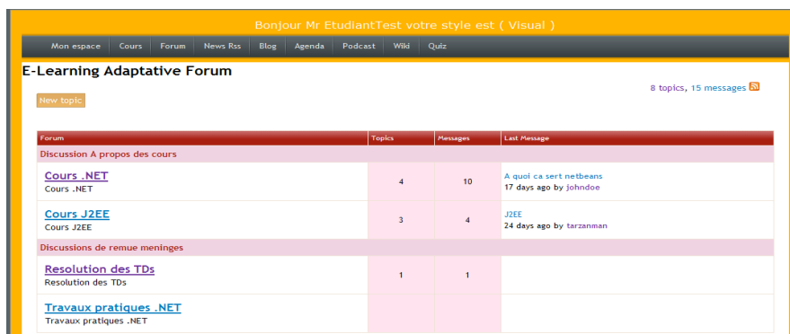
FIG. 5 – Forum adapté au profil étudiant

La figure 5 montre un espace de communication de type forum adapté à un apprenant visuel . On remarque la présence d'outils web2.0 adaptés ainsi que les différentes couleurs et limitations des espaces qui aident l'apprenant à mieux appréhender ces sujets.