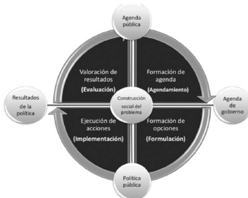
Figura 1. Tomada de Torres Melo y Santander (2013), elaborado con base en Dunn (2008).