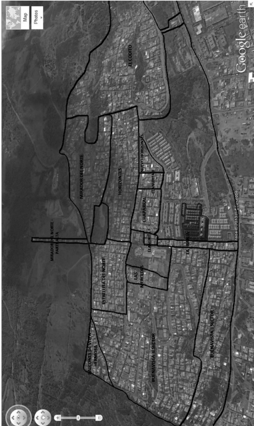
Mapa 3. Barrios y divisiones territoriales