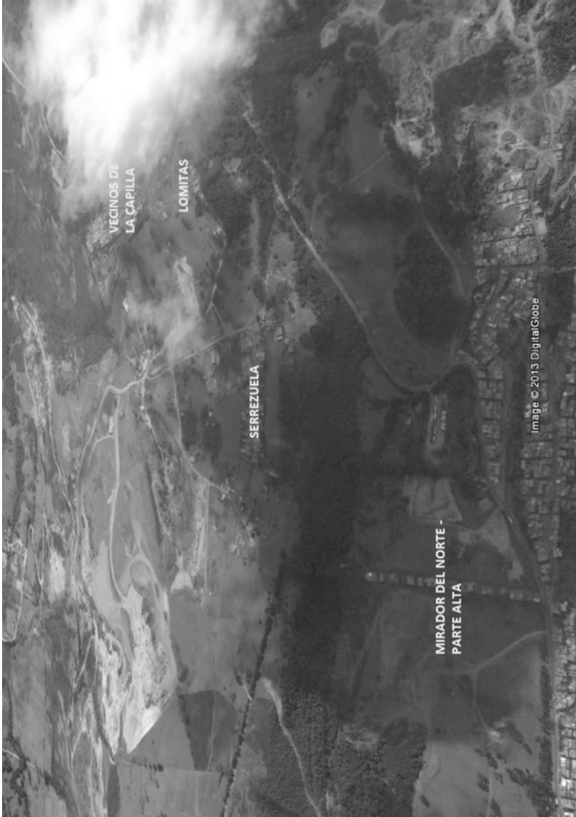
Mapa 4. Barrios asentados en la parte alta