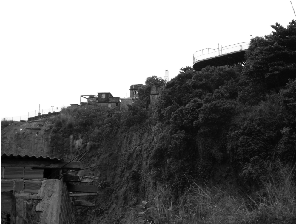
Doc. 3 – Belvédère mis en place dans le cadre du musée à ciel ouvert