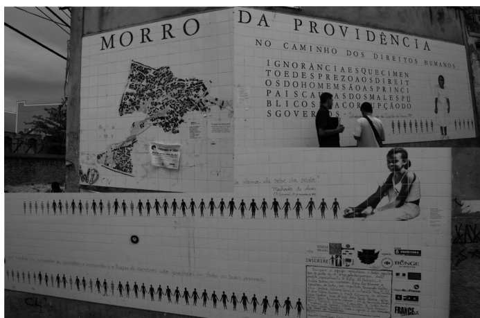
Doc. 2 – Azulejos de l’association « Inscire » figurant sur l’entrée du Morro da Providência, rue Barão de Gamboa (© N.Bautès, sept.2006)

Un marqueur dont l’existence tient de l’initiative d’associations ayant reçu l’aval et le soutien d’institutions étrangères, parmi lesquelles la Communauté Européenne et l’UNESCO.