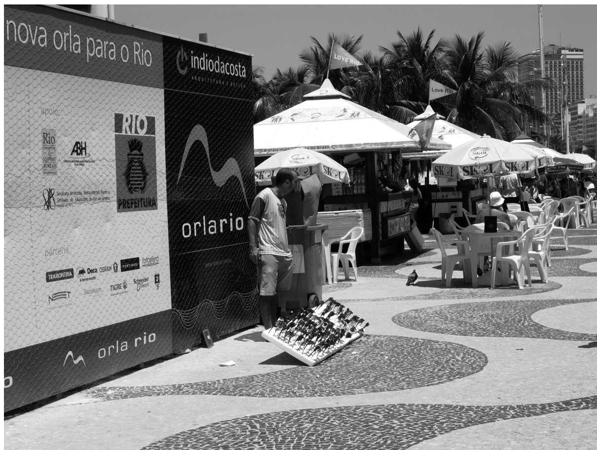
Doc. 4 – Vente ambulante sur le trottoir de Copacabana à l’angle de la palissade (© C. Reginensi, sept. 2006)

Pour mieux analyser ces expériences, nous avons travaillé 10 , avec une grille d’observation, et procédé à des parcours d’une durée d’environ une demi-heure sur l’avenue Atlântica qui montrent à la fois :