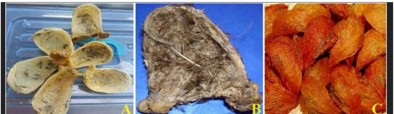
Gambar 1 Jenis warna SBW A. Putih B. Hitam disertai rumput. C. Merah (Lee et al., 2021)

Indonesia saat ini telah berhasil mengekspor SBW ke berbagai negara. Indonesia sendiri merupakan penghasil SBW terbesar di dunia dengan produksi mencapai 79.55% total produksi di dunia (Kementan, 2018). SBW Indonesia telah dijual ke 12 negara diantaranya China, Hongkong, Vietnam, Singapura, Amerika Serikat, Kanada, Thailand, Australia, Malaysia, Jepang, Laos, dan Korea Selatan (Kementan, 2020a). Salah satu negara tujuan terpenting untuk ekspor SBW Indonesia adalah Tiongkok. Harga dan kualitas SBW tergantung pada bentuk, warna dan asal geografis, harga SBW asal Indonesia bahkan bisa mencapai 7638 Dolar AS (Hao & Rahman, 2016; Ito et al., 2020). Menurut Jory & Saengthong (2007) total nilai perdagangan SBW di Tiongkok mencapai 4.2 juta Dolar AS pertahun. Menurut BPS (2020) ekspor SBW resmi ke Tiongkok terus meningkat, pada tahun 2015 hanya 18.4 ton, sampai puncaknya pada tahun 2019 mencapai 129.1 ton dengan nilai 219 juta dollar AS disajikan pada Gambar 2 (BPS, 2020).