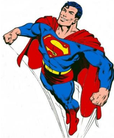
Figura 5 – Superman.

Os alunos de Jornalismo associam positivamente o personagem a si e aos alunos de Serviço Social, entretanto, o recorte para o curso de Jornalismo está relacionado a força da mídia, e o objetivo é alcançado quando a notícia é levada às pessoas. Em relação ao curso de Serviço Social a mudança do mundo não acontece, e não será alcançada por causa de uma fraqueza, que é representada pelos políticos da cidade. Os alunos de Administração, associam o personagem Superman ao curso de Serviço Social, porém não acreditam que a salvação do mundo pode acontecer.