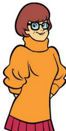
Figura 6 – Velma. Fonte: Hanna-Barbera (1969).

A personagem Velma foi associada aos cursos de Administração e Jornalismo pelos alunos de Serviço Social.