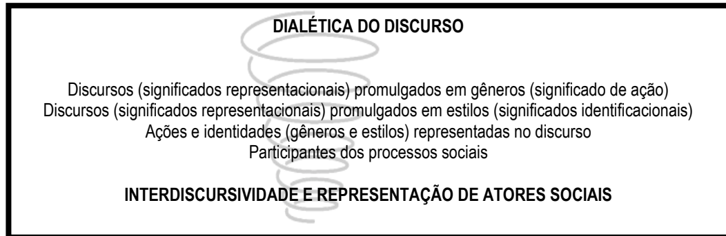
Figura 1 – Movimento Dialético do Discurso.

discurso como modo de representação de aspectos do mundo (Resende, & Ramalho, 2006). Diferentes discursos representam diferentes perspectivas de mundo, associadas a diferentes relações que as pessoas estabelecem com o mundo e que dependem de suas posições e as relações que estabelecem com outras pessoas (Fairclough, 2003).