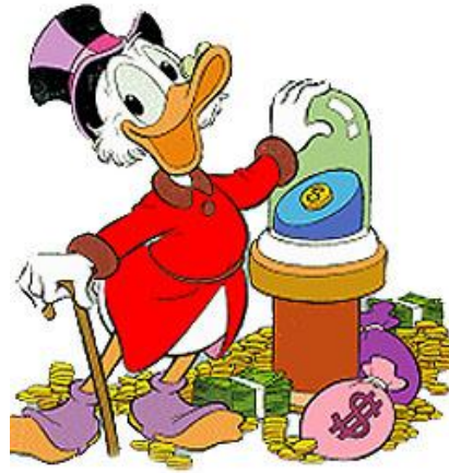
Figura II – Scrooge McDuck .

O personagem Tio Patinhas é referenciado para descrever os alunos do curso de Administração e Economia.