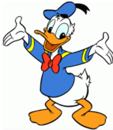
Figura 7 – Pato Donald. Fonte: Walt Disney (1934).

A metáfora "Pato Donald" proferida pelos alunos do curso de Jornalismo ao curso de Administração reproduz funções materiais utilitárias e valores sociais atribuídos ao curso. Nota-se que o personagem foi atribuído de forma pejorativa aos cursos de Economia e Jornalismo.