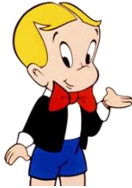
Figura 8 – Richie Rich.