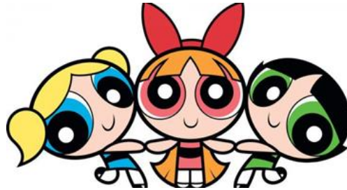
Figura 4 – The Powerpuff Girls .

A personagem “As Meninas Super Poderosas” foi atribuída a três cursos do instituto, são eles: Administração, Jornalismo e Serviço Social. É importante ressaltar que tal personagem foi atribuída aos grupos por eles mesmos.