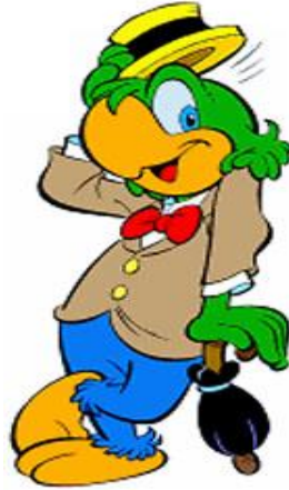
Figura 10 – José Carioca.

dinheiro. Já os alunos de Serviço Social associaram o mesmo personagem ao curso de Jornalismo para fazer uma alusão ao aspecto comunicativo e espontâneo dos últimos.