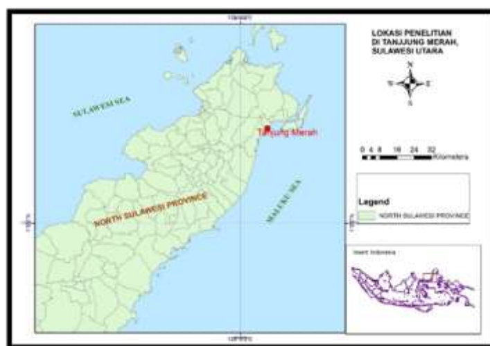
Gambar 1. Lokasi penelitian di pesisir Tanjung Merah, Bitung, Sulawesi Utara

Pengambilan sampel dilakukan pada saat surut terendah dengan bantuan aplikasi Tides (untuk mengetahui waktu surut terendah). Peletakan transek pada masing-masing lokasi untuk pengambilan data makroalga sebanyak 3 garis transek sepanjang 50 m yang ditarik tegak lurus dari pantai ke arah laut dengan asumsi bahwa penyebaran komunitas merata. Jarak antar transek yaitu 30 m dengan jarak kuadrat yaitu 5 m.