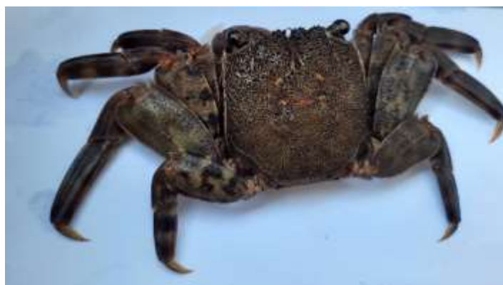
Gambar 2. Kepiting Jantan Sesarmops sp

Kepiting yang diambil dari perairan Desa Mokupa, Kec. Tombariri Kabupaten Minahasa, Sulawesi Utara (Teluk Manado) seperti yang tampak pada Gambar 2.