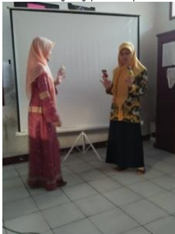
Gambar 2. Guru PAUD sedang praktik bercerita menggunakan boneka tangan

Pada kegiatan kedua, dilaksanakan pelatihan dini dengan teknik bercerita dan membacakan cerita menggunakan media buku besar ( bigbook ) yang didesain sebagai