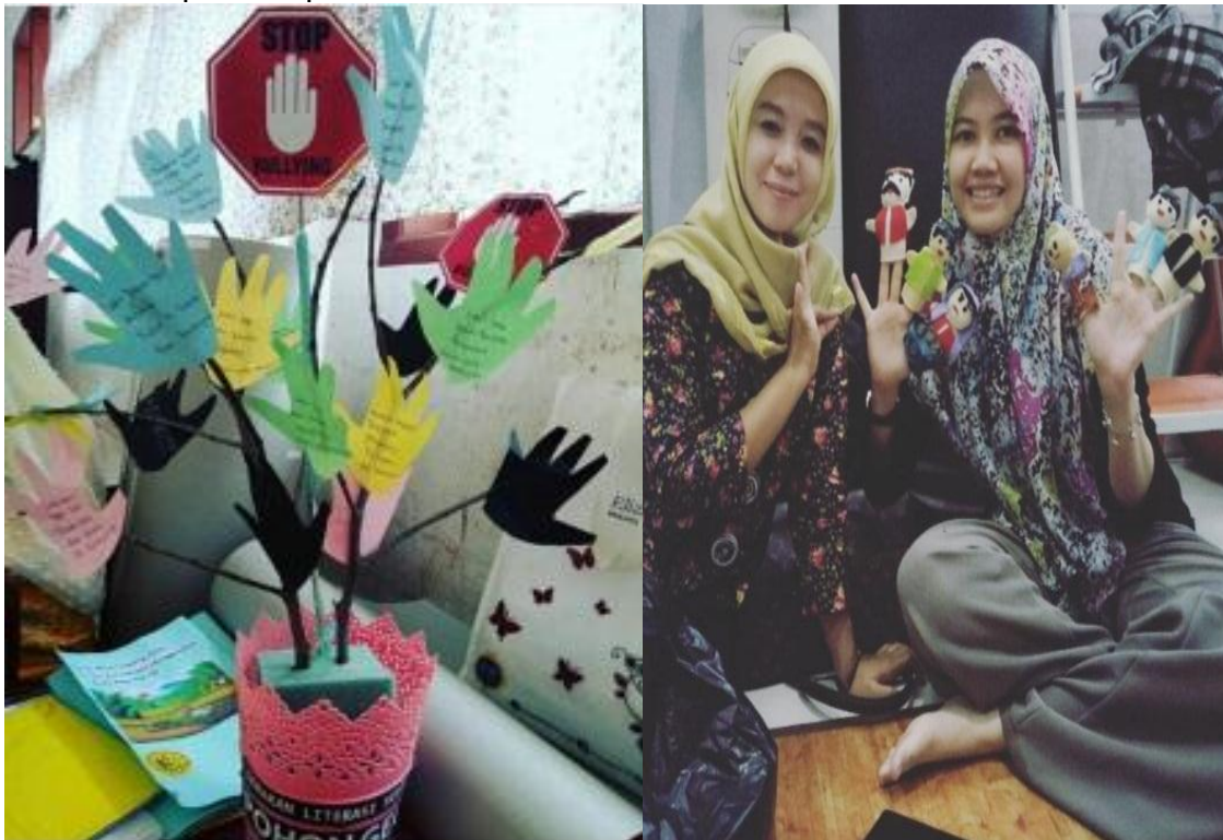
Gambar 3. Contoh media pembelajaran literasi (pohon literasi dan boneka jari)

Ketiga, para guru PAUD menyepakati bahwa kegiatan pelatihan semacam ini sangat jarang dilakukan. Padahal guru-guru mengakui sangat mengharapkan pendampingan dan pelatihan agar dapat meningkatkan kemampuan dan pengetahuan dalam konsep dan teknik pengajaran anak usia dini. Jadi, guru mengakui bahwa sebelum kegiatan pelatihan ini para guru belum mengetahui dan memahami gerakan literasi apalagi literasi dini. Media yang biasa digunakan di dalam pembelajaran pun monoton karena memang fasilitas di PAUD terbatas. Namun setelah dilakukan pelatihan guru menjadi lebih kreatif dan inovatif. Para guru dapat menciptakan media sendiri sebagai alat bantu dalam pembelajaran berbasis literasi.