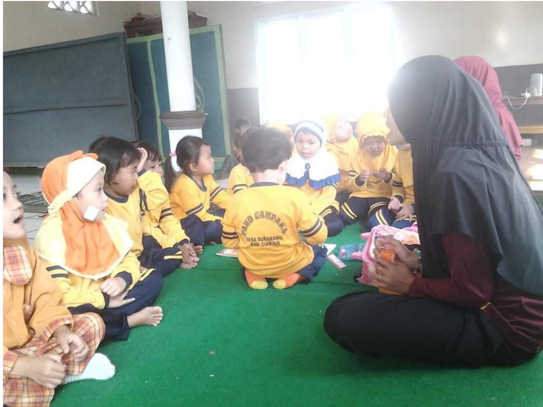
Gambar 1. Guru PAUD sedang mengajar sebelum pelaksanaan pengabdian