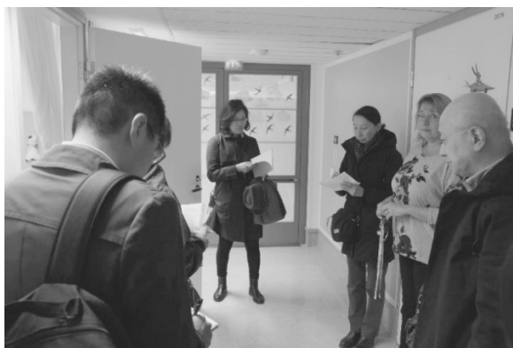
写真7 Almaのスタッフへのインタビューの様子