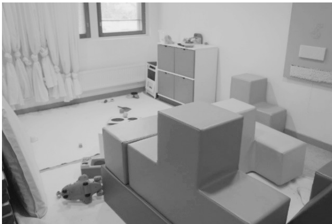
写真4 プレイルームの様子

安心で健康的な衣食住の生活環境の提供とともに、利用している子どもが毎日学校に通学できるように、規則正しい生活リズムを獲得できるような取り組みも実施されている。また、ハイキング等の外出、近隣の屋内プールを利用したスイミングなどの各種の屋外活動や工芸・陶芸も実施しており、アルマにおける生活支援が子どもの発達支援の基礎になるように様々な工夫が随所になされている。こうした活動を通して、子ども・家族との関りやコミュニケーションを丁寧に行いながら、家族ケアを実施している（写真5・写真6）。