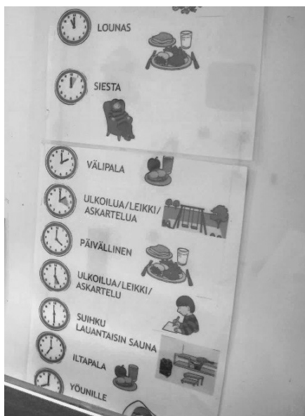
写真5 1日のスケジュールの視覚提示

安心で健康的な衣食住の生活環境の提供とともに、利用している子どもが毎日学校に通学できるように、規則正しい生活リズムを獲得できるような取り組みも実施されている。また、ハイキング等の外出、近隣の屋内プールを利用したスイミングなどの各種の屋外活動や工芸・陶芸も実施しており、アルマにおける生活支援が子どもの発達支援の基礎になるように様々な工夫が随所になされている。こうした活動を通して、子ども・家族との関りやコミュニケーションを丁寧に行いながら、家族ケアを実施している（写真5・写真6）。