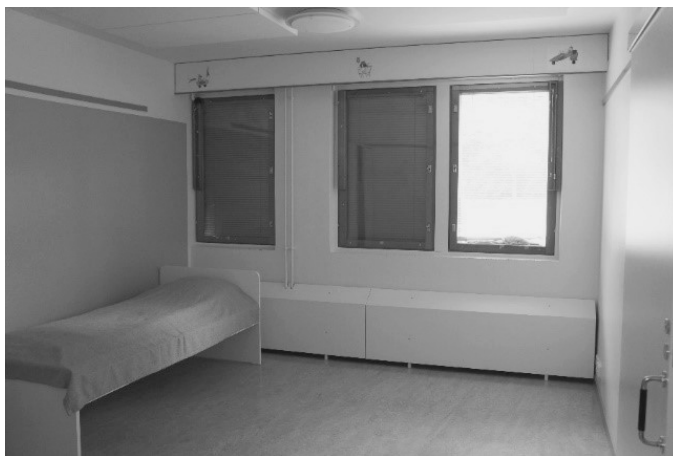
写真2 子どもが生活する居室

アルマには一人部屋が7部屋あり、各部屋にはトイレとシャワー設備が完備されている（写真2）。各部屋は一時的であっても居住する子どもの好みによって自由に模様替え等を行うことができるようになっている。この他にもゆったりとしたリビングスペース、プレイルーム、キッチンなどの生活空間が整備されている（写真3・写真4）。