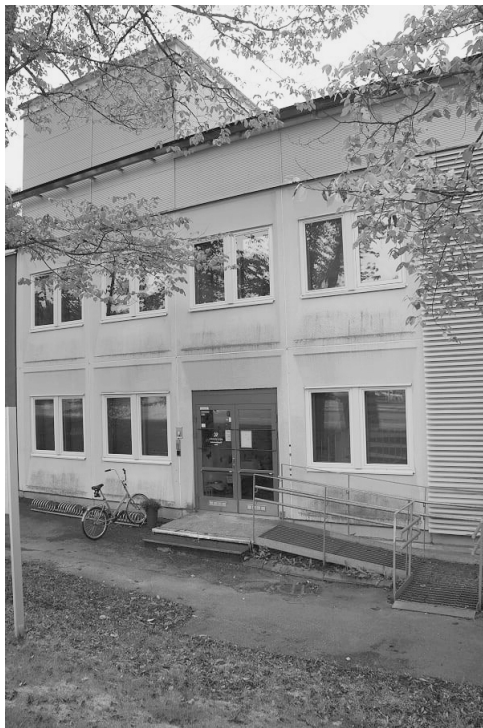
写真1 アルマの外観 ( https://vammaispalvelut.mehilainen.fi/tilapaishoitokoti-alma )