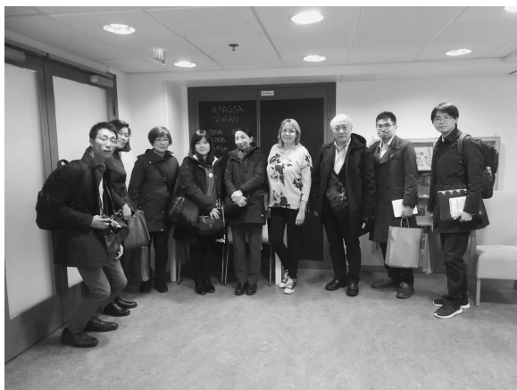
写真8 AlmaのFacebookに調査訪問記事掲載 「Tänään Almassa kävi vieraita Japanista asti.」(2019-09-17)