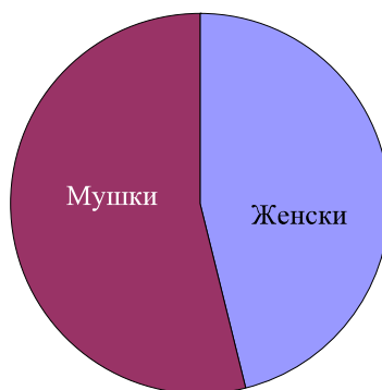
Графикон 1 - Полна структура у експерименталној и контролној групи

Након истраживања смо утврдили да се у школама за децу оштећеног слуха у Србији налази 76 ученика који поред оштећења слуха имају једно или више додатних оштећења. Структура групе ученика са вишеструком ометеношћу, с обзиром на демографске варијабле и тип оштећења, приказана је у табелама и графиконима који следе.