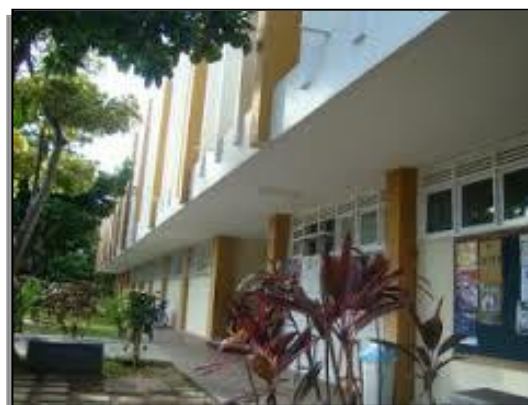
Escola de Engenharia da UFRN [Outro prédio onde funcionou o Instituto de Matemática]