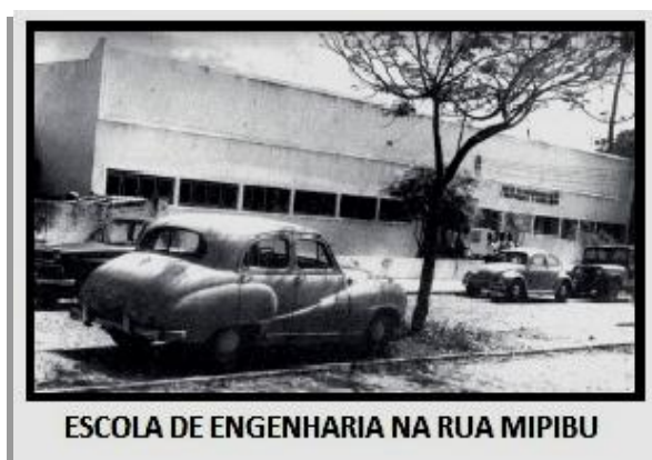
Escola de Engenharia da UFRN [Uma das sedes do Instituto de Matemática]