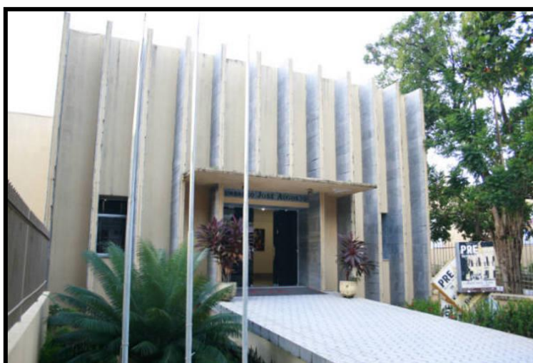
Faculdade de Filosofia, Ciências e Letras de Natal – FAFI [Atualmente funciona a Fundação José Augusto]