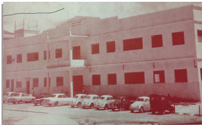
Instituto de Matemática da UFRN (Atualmente funciona a Secretaria de Tributação de Natal)