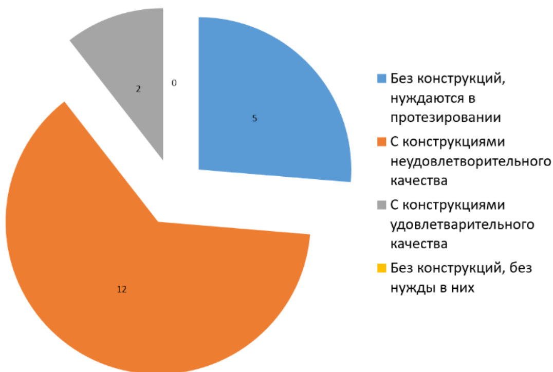
Рисунок 1. Круговая диаграмма, отражающая потребность пациентов в ортопедическом лечении.