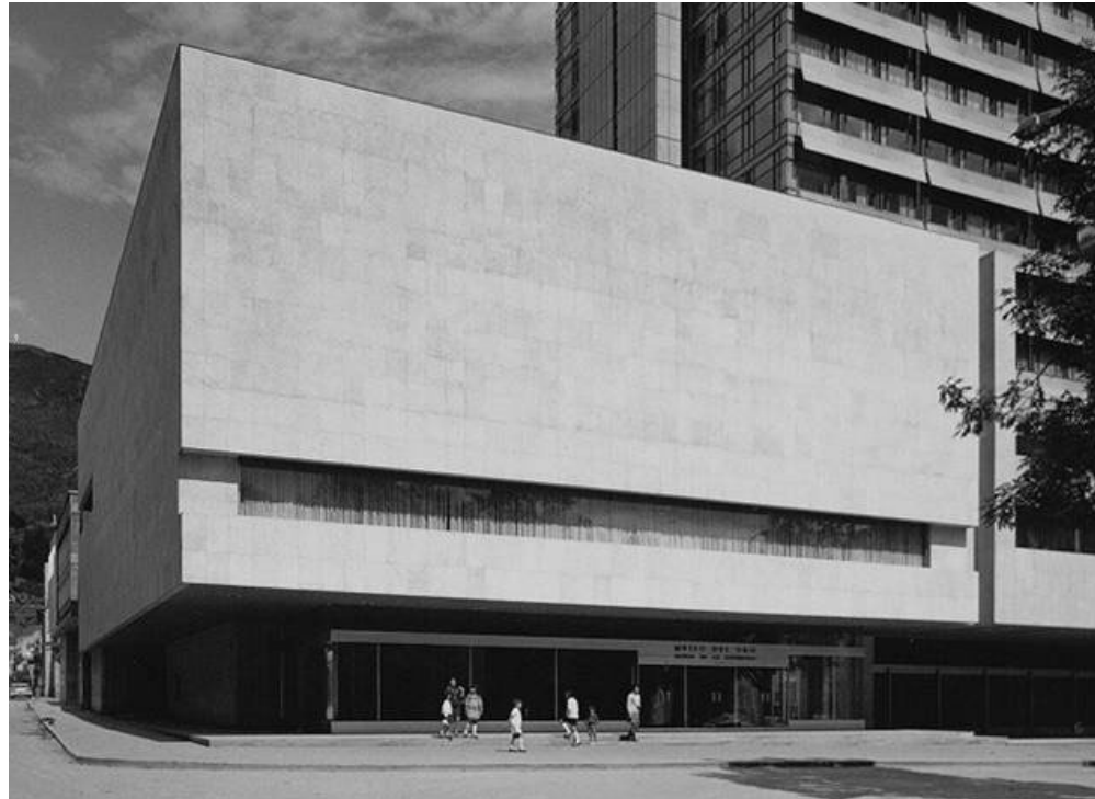
Fig. 2. Edificio del Museo del Oro inaugurado en 1968.