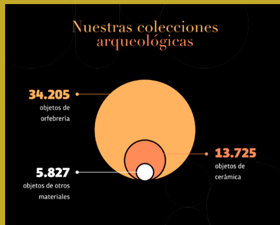
Figs. 3. Infografías: Kilka.