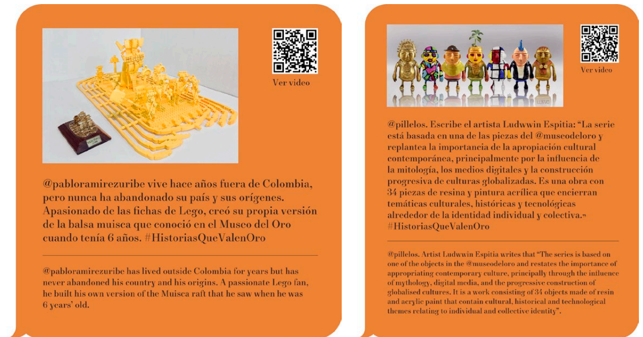
Figs. 4. #HistoriasQueValenOro

Durante 2020 y lo corrido de 2021 el Museo del Oro realizó –y seguirá realizando– un conjunto de actividades y productos de divulgación para dar visibilidad a los aportes que ha hecho el Banco de la República por medio del Museo, durante sus 80 años de existencia, al país y al mundo configurando un patrimonio que nos identifica adentro de Colombia y nos representa afuera.