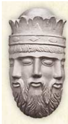
Ilustração 1 Deus não é uma trindade.