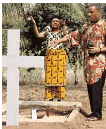
Ilustração 3 Não há nenhum motivo para adorar os mortos ou ter medo deles.