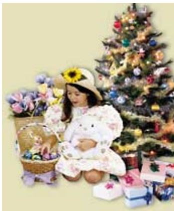
Ilustração 2 O Natal e a Páscoa moderna vêm de antigas religiões falsas.