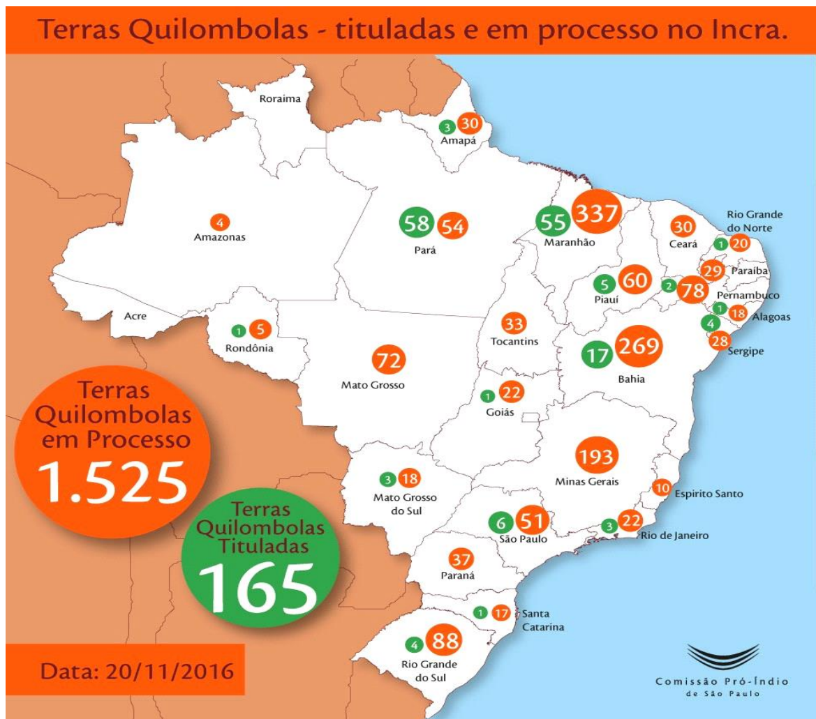
Figura 2 - Terras Quilombolas Tituladas e em Processo de Titulação no Instituto Nacional de Colonização e Reforma Agrária (INCRA). 2

O mapeamento a seguir mostra das Terras Quilombolas Tituladas e em processo de titulação, isso de acordo com o Instituto Nacional de Colonização e Reforma Agrária (INCRA), (2016).