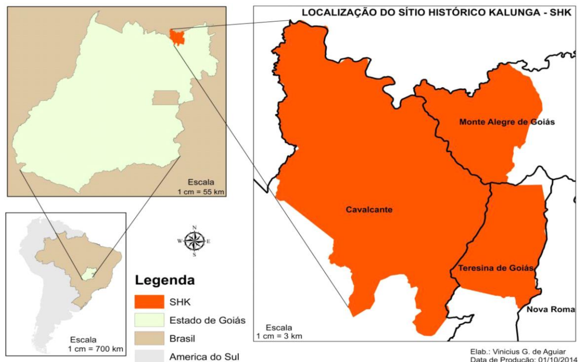
Figura 3 – Mapa de Localização do SHK – Sítio Histórico Kalunga. 3

Fazendo referência a Baiochi (2006), Anjos e Cypriano defendem que o Kalunga é considerado o mais importante da região centro-oeste e um dos maiores do país, em termos numéricos e histórico, ocupando uma área de 253,2 mil hectares, com uma população estimada em mais de 6 mil habitantes. Em 1991 foram reconhecidas pelo governo de Goiás como Sítio Histórico e Patrimônio Cultural Kalunga. Como podemos observar no mapa abaixo: