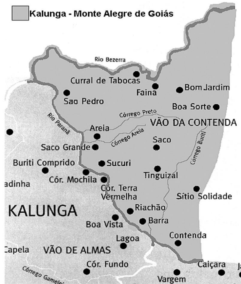
Figura 4 – Mapa do Quilombo Kalunga do Município de Monte Alegre de Goiás, localização da comunidade Quilombola-Kalunga Tinguizal, local da pesquisa de campo. 4