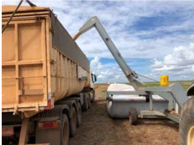
Figura 5. Extratora realizando a descarga do silo em caminhão.