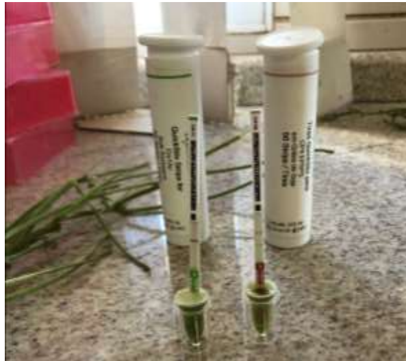
Figura 9. Teste de Transgenia com utilização de tiras de fluxo lateral.