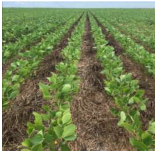
Figura 2. Lavoura de Soja na Fazenda Bela Vista - BA.

As plantas atípicas encontradas em campos com soja convencional eram levadas ao laboratório para passarem pelo teste de transgenia.