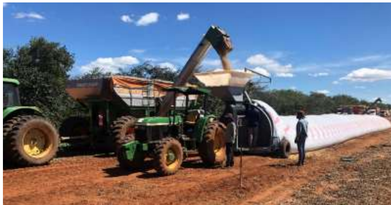
Figura 4. Embutidora no processo de enchimento do silo bolsa.

O silo bolsa utilizado no armazenamento a campo tem 60 m de comprimento e 2,7 m de diâmetro, permitindo armazenar cerca de 3.000 sacas (180 toneladas) dependendo do grão. É necessário o uso de uma máquina embutidora para realizar o processo de enchimento do silo, como apresentado na Figura 4. Essa máquina possui um mecanismo que recebe os grãos e com o auxílio de uma rosca sem fim, os conduz ao interior do silo. A embutidora permanece o tempo todo engatada em um trator e o controle do fluxo de grãos é feito através do freio desse trator.