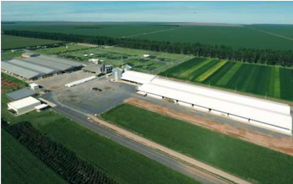
Figura 1. Estrutura da empresa J&H Sementes (J&H Sementes, 2019).

1 são apresentadas as instalações da empresa, contando com UBS e galpões para armazenamento dos sacos de semente.