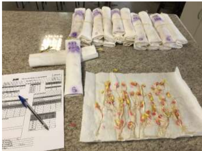
Figura 6. Contagem das sementes que germinaram, após o pré-condicionamento e 6 dias em sala de germinação.

Esse teste segue os padrões descritos pela RAS (Regras para Análise de Sementes), material fornecido pelo Ministério da Agricultura, Pecuária e Abastecimento.