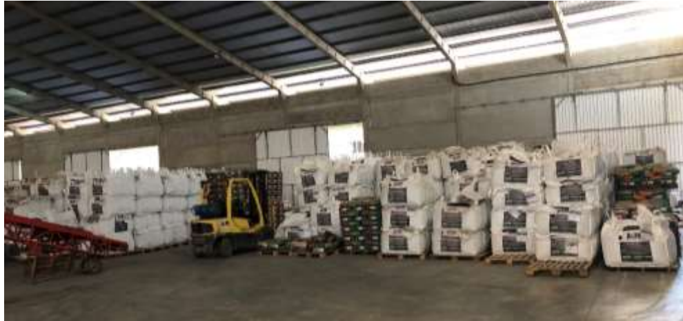
Figura 3. Bags e sacos de sementes antes de serem cobertos por lona plástica para o expurgo.

Segundo a recomendação na bula do produto, o período para o produto fazer efeito é de cinco dias, e o intervalo de segurança para reentrada de pessoal é de nove dias. Todo o Equipamento de Proteção Individual necessário foi utilizado durante o expurgo.