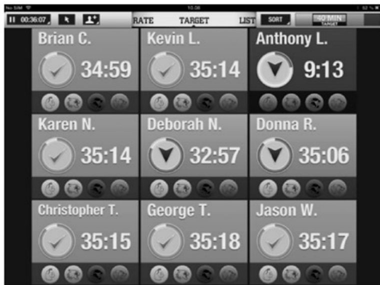
Kuva 2. Polar GoFit -sovelluksen tavoitenäkymä.

Kuva 2 on esimerkki PolarGoFit'in sykkeenseurantanaikymästä. Oppilaan nimen alla oleva pyöreä kenttä ilmaisee, onko oppilas tavoitesykealueella (vihreä) vai ei (punainen). Sen vieressä olevat numerot ilmaisevat puolestaan tavoitealueella vietetyn ajan minuutteina ja sekunteina. Alarivin pyöreät symbolit ovat saavutettuja merkkejä eli