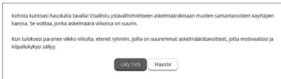
Kuva 1. Kuvakaappaus Garmin Connectin askelhaasteesta

Tämän kaltaisten esimerkkien kautta on mahdollista havainnollistaa sitä, että liikuntateknologiat eivät lajittele vain liikkumismuotoja ja liikkumisen indikaattoreita, mutta myös liikkujia itsejään. Yksi kuvaava esimerkki on GPS-teknologia-yhtiö Garminin liikuntateknologiasovellus Garmin Connectin askelhaaste-toiminto: Siinä ryhmät muodostetaan taustamuuttujiltaan samankaltaisista käyttäjistä ja ryhmästä toiseen siirrytään askelmäärien vertailuun perustuen: päivittäisen askelmäärän lisääntyessä ja/tai vähentyessä (ks. kuva 1).