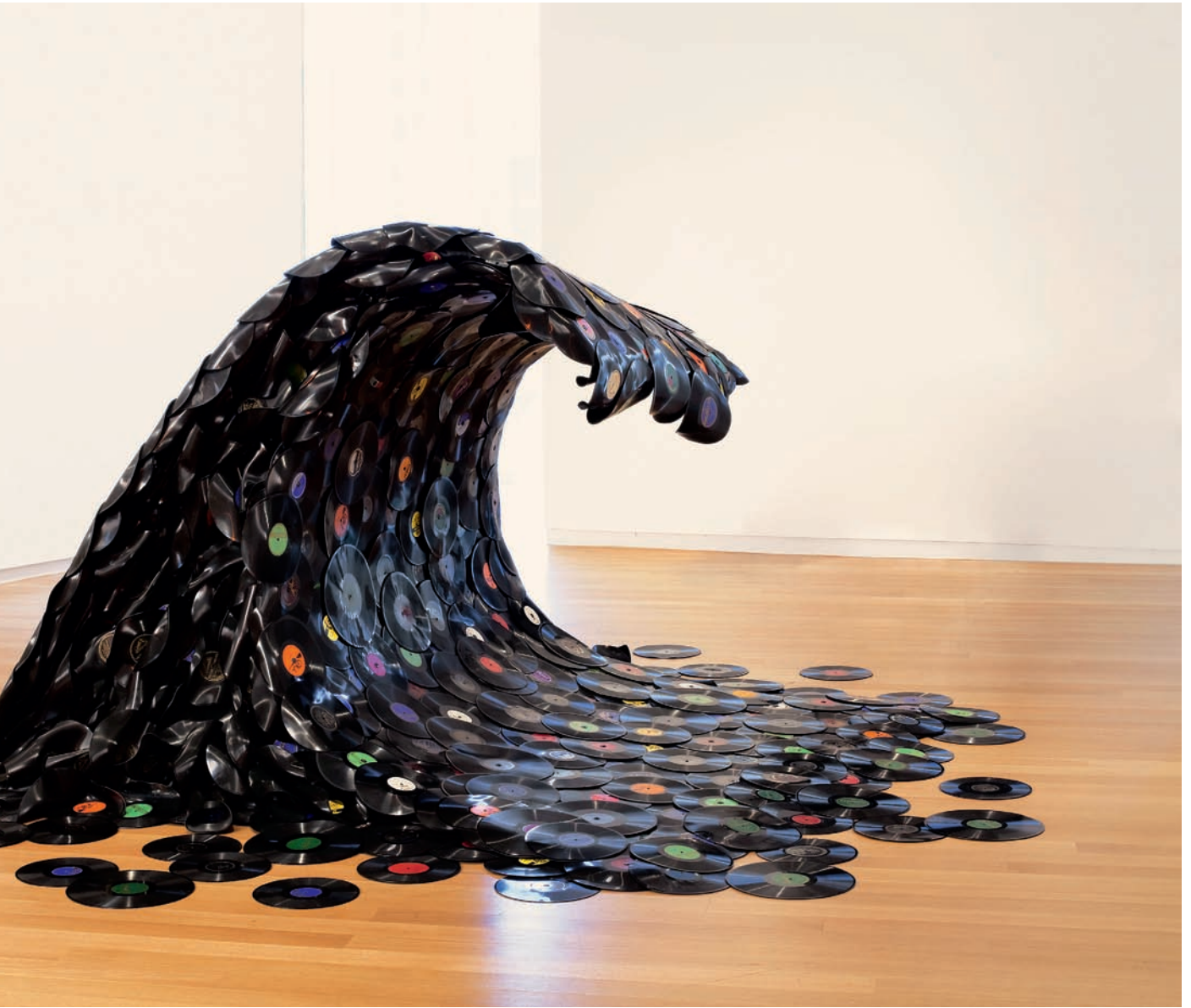
Fig. 5 Jean Shin, Sound Wave , installation au Museum of Arts & Design, New York, 2008. Avec l'aimable autorisation de l'artiste et de Art Projects International, New York.