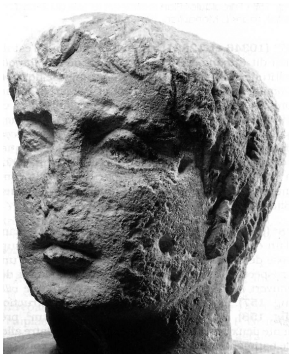
○ Fig. 2. Polychromie : tête masculine découverte aux environs de Forcalquier (Alpes-de-Haute-Provence) appartenant à un monument funéraire qui conserve dans sa chevelure des traces d'ocre (Bérard 1997, p. 206).

Cette tête, d'après les traces visibles sur le sommet et à l'arrière du crâne, montre qu'elle devait être couronnée (fig. 2). Cette représentation officielle d'un notable local ou provincial datée du IV e siècle de notre ère pourrait avoir pour origine un atelier de l'Italie du Nord 29 . À cette série on peut également ajouter la tête vraisemblablement d'Octave (H. : 43,5 cm) découverte au début du XX e siècle (Le Tignet, Alpes-Maritimes), puis perdue et retrouvée dans les années quatre-vingt 30 .