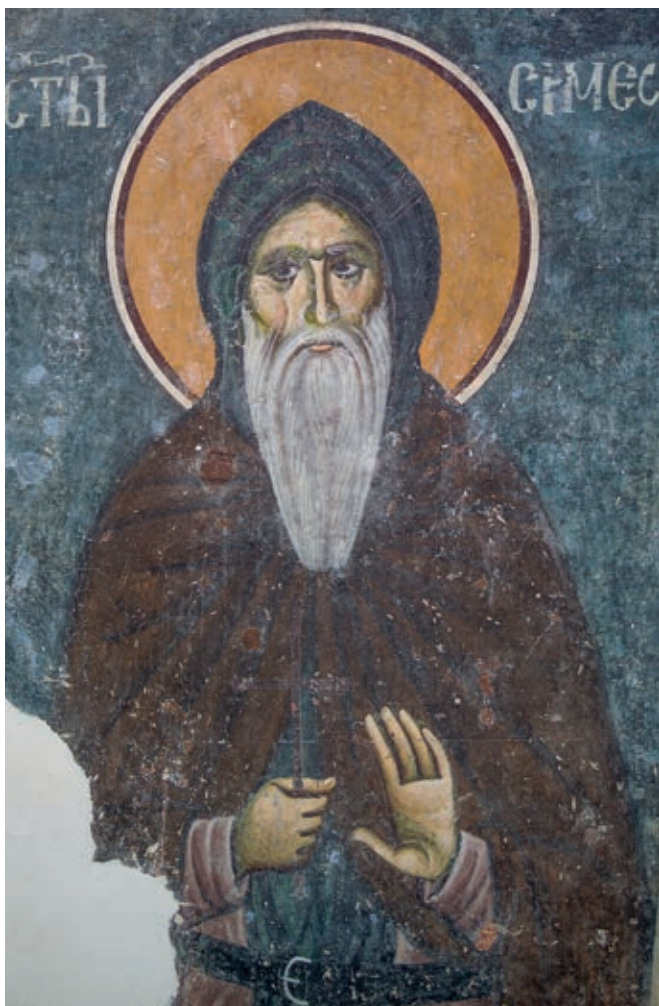
Fig. 31. Sopoćani monastery, Parekklesion of St. Simeon of Serbia, St. Simeon of Serbia