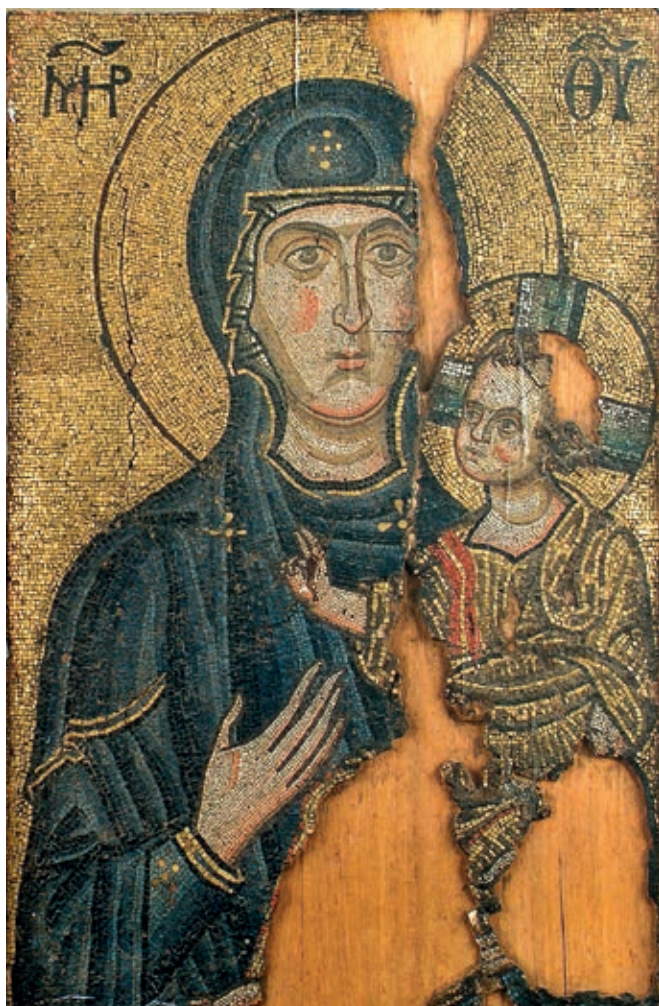
Fig. 30. Mosaic icon of Mother of God Hodegetria with Christ, Hilandar monastery

with the Empire. When in the 12 th century Serbia actually became the only actor in political relations with Byzantium in the Western Balkans, all its political efforts were geared to winning independence from Constantinople. Relations followed a set pattern, established in the previous centuries: Byzantium persistently treated Serbian rulers (grand župans ) as imperial subjects (administrators), whereas the Serbs saw in Byzantium an enemy still strong, but were not seeking – at least not ostensibly – either reliance on its civilisation or an example to emulate. 13 By that token, not even the ancient remains of the Empire's material culture which the Serbs encountered when