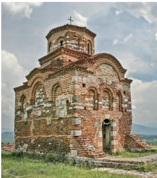
Fig. 28. Gornji Matejevac, Latin Church