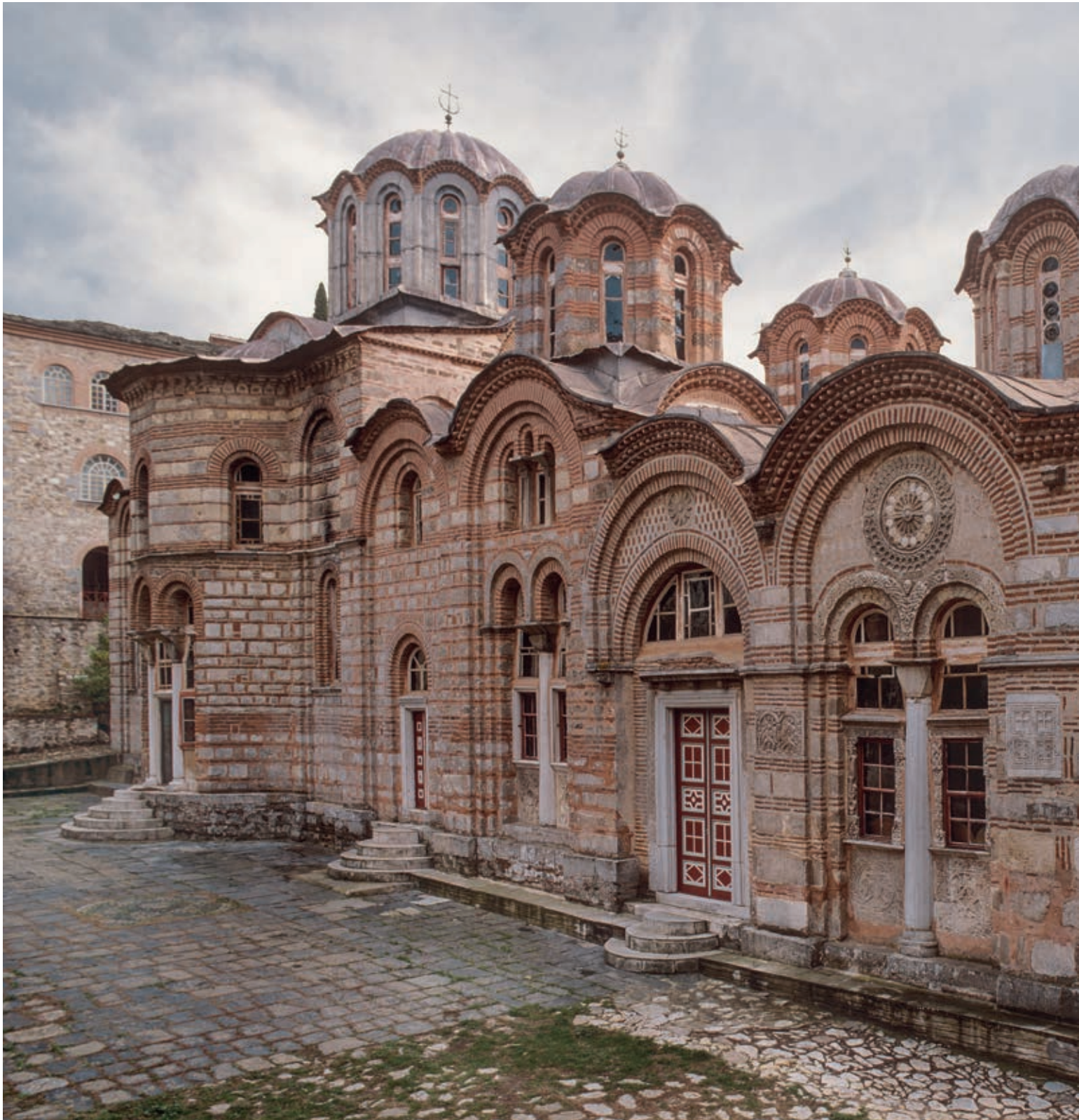
Fig. 33. Hilandar monastery, katholikon