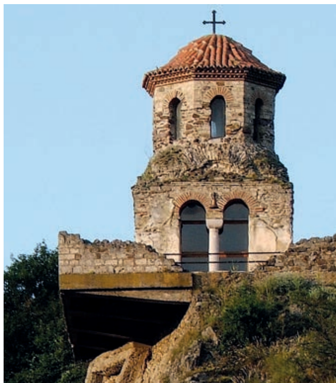
Fig. 29. Stara Pavlica monastery

um bishoprics) 11 was of more far-reaching significance. In those parts of the Empire, for the first time the Serbs were under the more direct influence of the Byzantine Church.