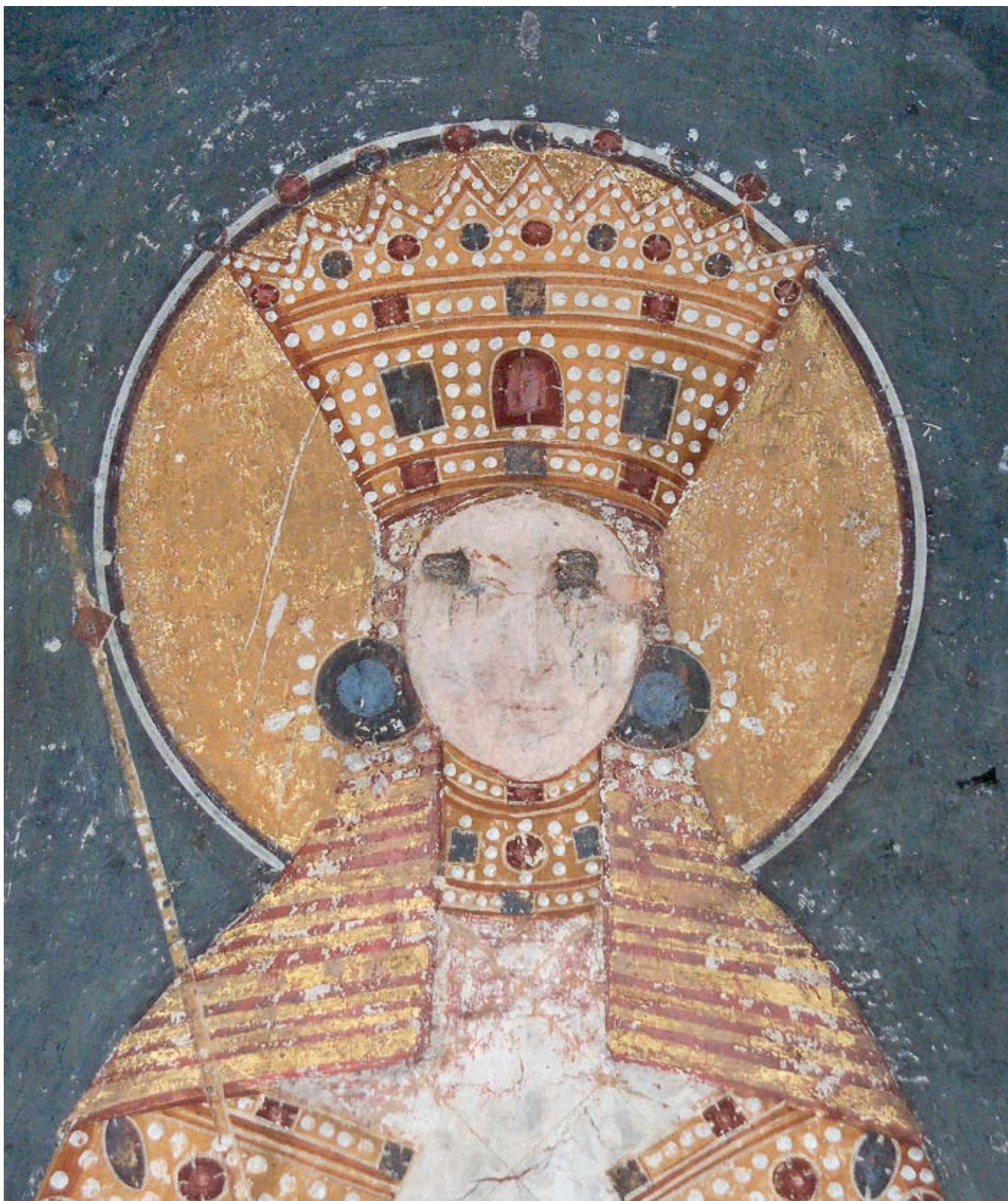
Fig. 35. Gračanica monastery, Queen Simonida