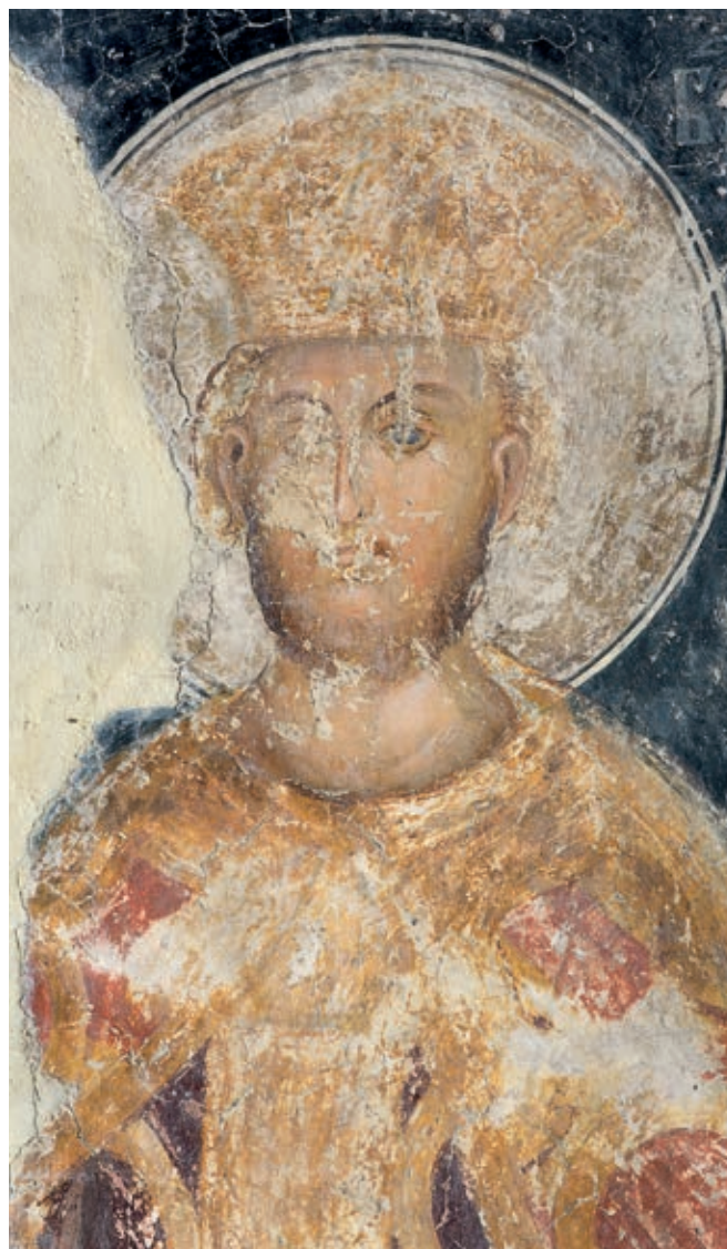
Fig. 38. Kalenić monastery, Despot Stefan Lazarević

Constantinople's reaction to Dušan's proclamation and coronation as emperor, in its own way reflects the complexity of Serbo-Byzantine relations in the mid-14 th century. Dušan had travelled the path from being a king to becoming an emperor, by aiding both parties in the Palaiologos-Kantakouzenos dynastic dispute. He had first aligned himself with John Kantakouzenos, and then with the Constantinople regency – both sides trying to protect the under-aged John V Palaiologos' claim to the throne. The complexity of political and military circumstances which shook the Eastern Empire in the 1341–1354 civil war, and in which Dušan took part, resulted in the absence of an official reaction from Constantinople to Dušan's coronation. Only when John V Kantakouzenos (1347–1354) took the sceptre did Byzantium respond. Yet, it was an ambivalent response. While John V Palaiologos addressed him as 'Emperor of Serbia' in a charter issued to Hilandar (1351), 51 Kantakouzenos never acknowledged the imperial title of his former ally and subsequent adversary. Both the ascent of the Serbian Church to the rank of a patriarchate and Dušan's rise to imperial power drew a reaction from the Ecumenical Patriarchate of Constantinople led by Patriarch Kalistos, it is believed, only around 1352. 52 Although the edict excommunicating Dušan, the Serbian patriarch Joanikije (who crowned the king 'Emperor of the Serbs and the Greeks') and higher