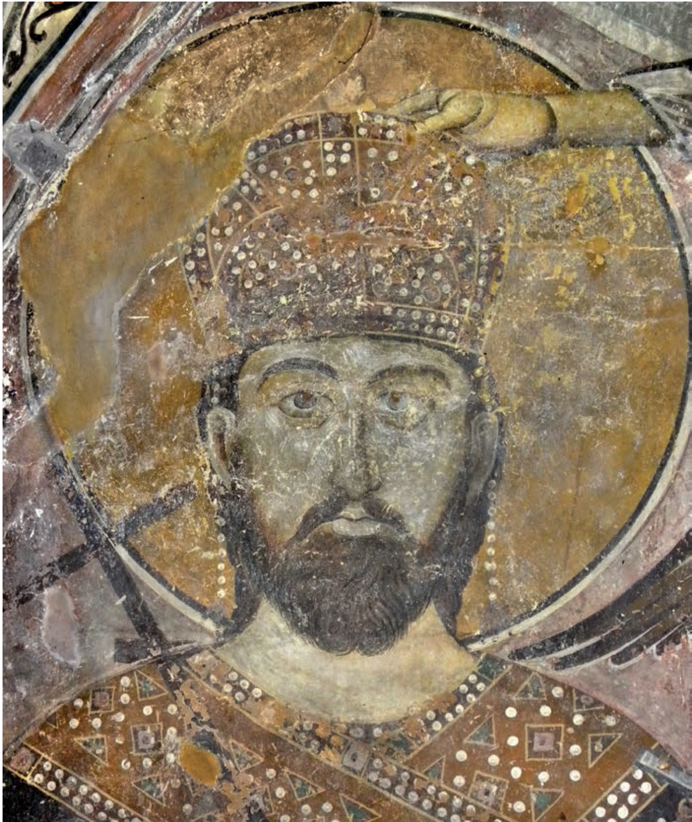
Fig. 37. Pološko, Church of St. George, King Stefan Dušan