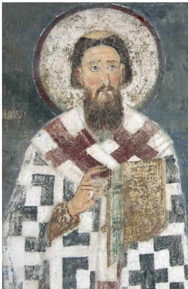
Fig. 32. Mileševa monastery, Archbishop Sava of Serbia

and granting him the carski san (ruler's title). 18 Whether the inclusion of the local župan into the Byzantine hierarchy strengthened Nemanja's position in relation to his older brothers has not been ascertained, 19 but judging by the hagiographies about Symeon, this policy towards Byzantium was of great importance for all Zavida's sons. The news that the reason for a dispute among the brothers was the fact that Nemanja, without seeking his older brothers' approval, began to build churches 20 in his lands, therefore deserves attention. These were two