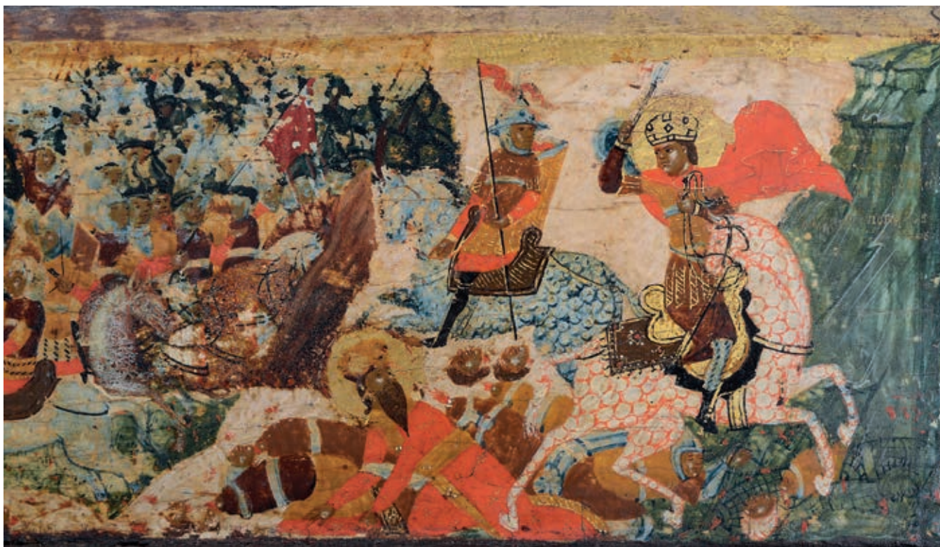
Fig. 36. Vita icon of St. Stefan of Dečani, detail: the Battle of Velbužd, work of the painter Longin, Dečani monastery

By the reign of Stefan Uroš II Milutin (1282–1321, figs. 34, 98, 237–239) Byzantine influence had penetrated almost all spheres of medieval Serbian society. It is a process often called the Byzantinisation of Serbia and its foundations lay in Serbia's appropriation of vast swathes of territory previously under the Eastern Empire. Byzantine Macedonia, whose northern parts had been conquered by Serbian forces during King Milutin's time (fig. 208), proved to be a hub of many Byzantine institutions that Serbia would embrace. 41 This direct encounter with the Byzantine state and social structures, and their adoption and adaptation to the conditions within the mother state, rapidly changed Serbian society.