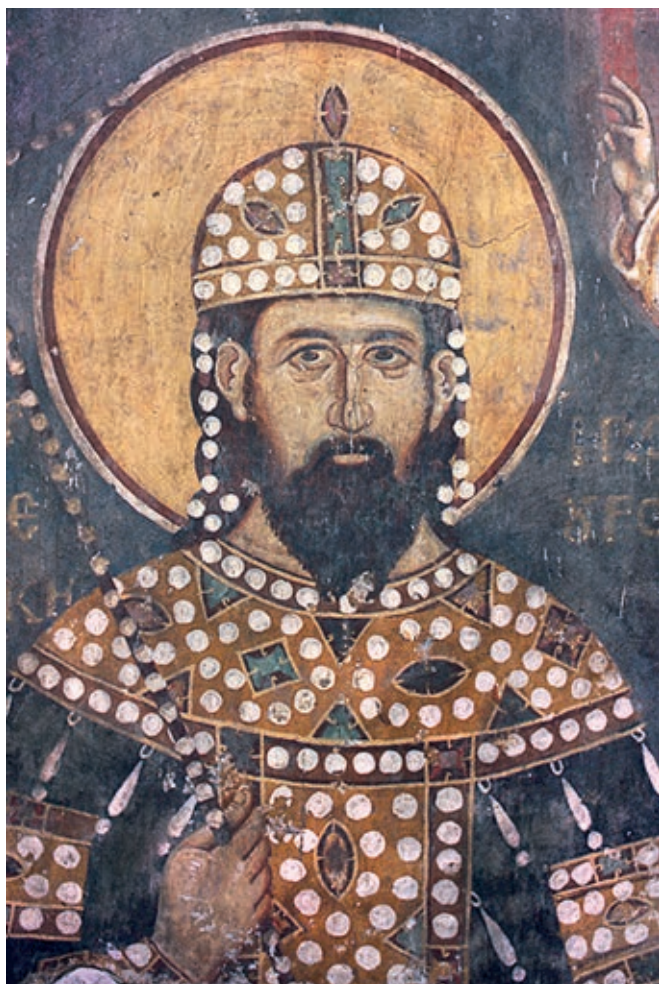
Fig. 34. Arilje, Church of St. Achilleos, King Milutin

strengthening of his state, but one that also led to Serbia's true inclusion in the Byzantine hierarchy of states and their rulers.