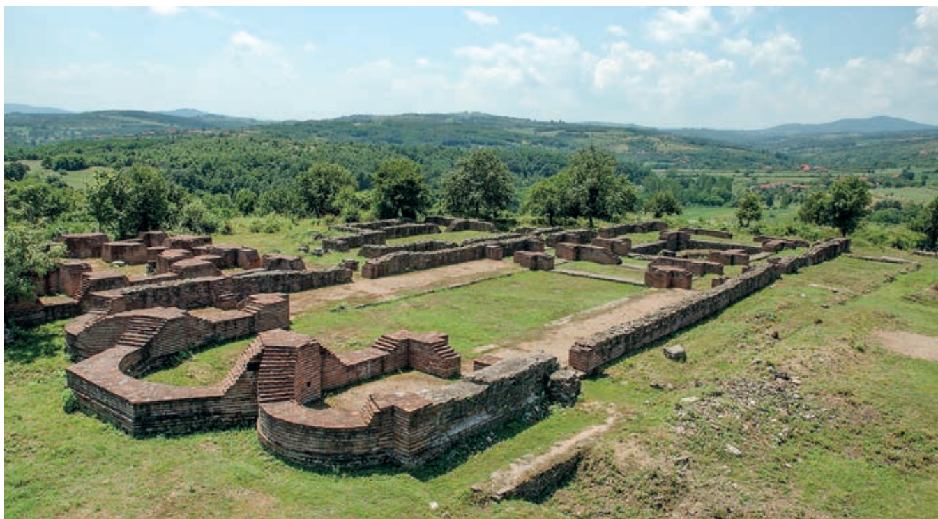
Fig. 27. Iustiniana Prima (Caričin Grad), episcopal basilica

and Serbia (probably in 1081, fig. 77) 7 – are only some indicators of the modest reach Byzantium’s policy and cultural influence had in the Western Balkans.