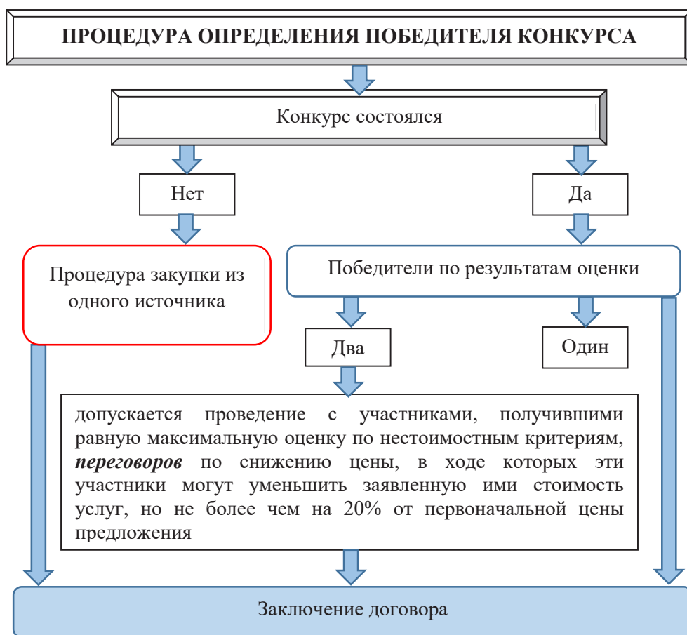
Рис. 2. Процедура определения победителя конкурса на закупку аудиторских услуг в Республике Беларусь