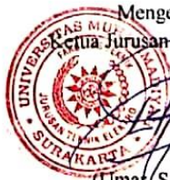
(Umar, S.T, M.T) NIK. 731

Mengetahui, Ketua Jurusan Teknik Elektro