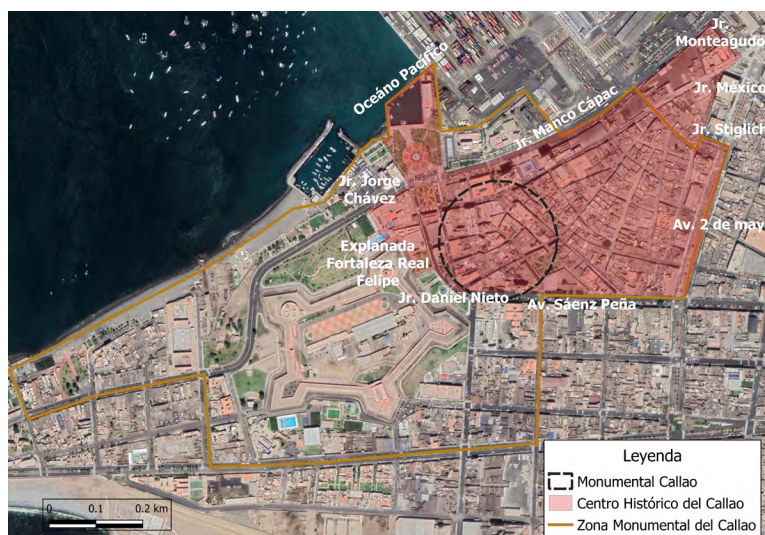
Perímetro del centro histórico del Callao

Este concepto hace referencia a la transformación de barrios en enclaves exclusivos y prósperos debido a la presencia de empresas de entretenimiento y centros turísticos. Así, el turismo es una estrategia del desarrollo económico que une las transformaciones socioeconómicas a nivel global con la producción de espacios residenciales y comerciales para un sector adinerado (Gotham, 2005).