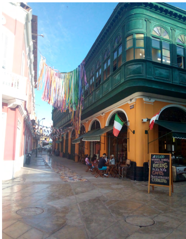
Figura 4 Jirón y pasaje Gálvez

En la segunda experiencia, estas limitaciones también perjudicaron a los miembros de la iglesia Matriz con la apertura colindante de comercios y restaurantes en el pasaje Gálvez (Figura 4). En dicho pasaje, se realizaban talleres artísticos, visitas guiadas o se aglomeraba de turistas siempre con un fuerte fondo musical interrumpiendo e impidiendo las actividades religiosas.