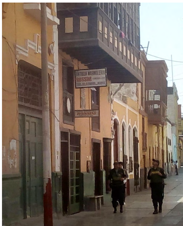
Figura 5 Policías en los alrededores

Por un lado, la policía siempre ubicada en lugares estratégicos o caminando entre los jirones (Figura 5) y, por el otro, la seguridad municipal posicionada en las plazas Matriz y Gálvez. Generando así una especie de frontera simbólica, un enclave de seguridad, que garantice a los turistas su recorrido y su seguridad.