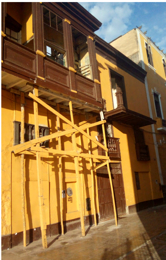
Figura 3 Viviendas