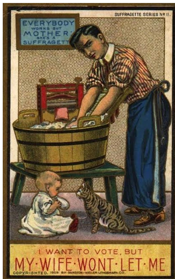
Obrázek 2: Plakát amerického antifeministického hnutí z roku 1909

V době, kdy feministky usilovaly o získání volebního práva, se v ulicích objevovaly plakáty, které je zesměšňovaly, často je zobrazovaly jako vzhledově ošklivé ženy, které nenávidí muže a snaží se rozbít tradiční společnost, jiné pak ukazovaly, jak by mohl dopadnout svět, kdyby se ženy dostaly k moci (viz. Obrázek 2).