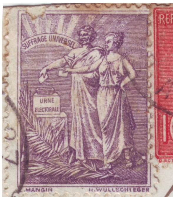
Obrázek 3: Poštovní známka Hubertine Auclert na podporu všeobecného volebního práva

Jednou z jeho hlavních představitelk byla Hubertine Auclert, o které jsme se již zmiňovali v úvodní kapitole o feminismu. Ta vydávala týdeník Občanka 31 , ve kterém vyzývala k udělení volebního práva ženám. V roce 1901 nechala vytvořit poštovní známku (viz. Obrázek 3) zobrazující ženu a muže u volební urny, později vznikla pohlednice se stejným motivem. Při stém výročí vydání Napoleonova občanského zákoníku pořádá protestní akce za jeho úpravu, která by zaručovala rovnost mezi pohlavími, a neúnavně pokračovala v boji za politická práva žen.