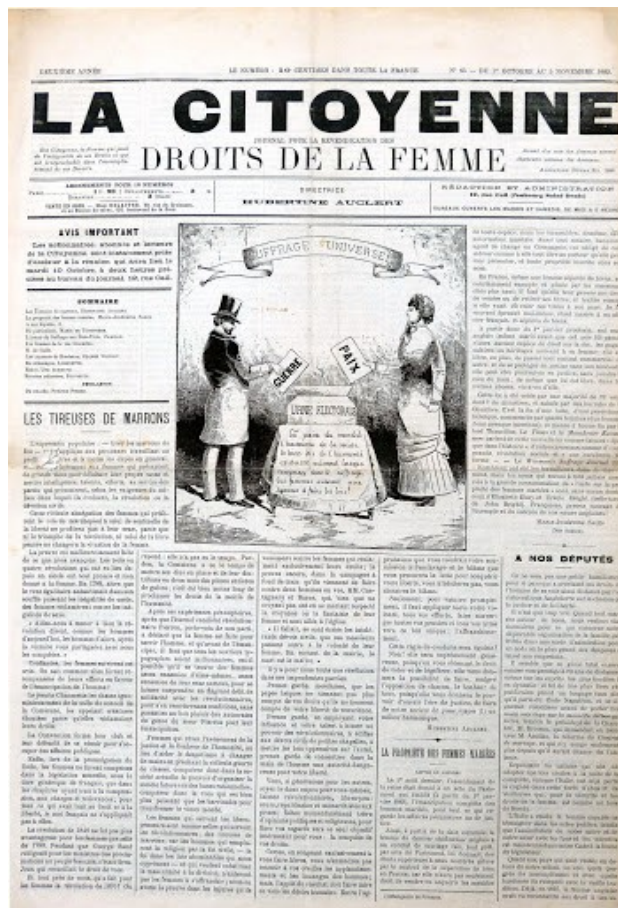
Obrázek 1: Časopis Občanka z roku 1882, zdroj: http://www.museehistoirevivante.fr/

kteřé se jevíly jako důležitější témata. Francouzsky si tak na volební právo musely počkat až do roku 1944.