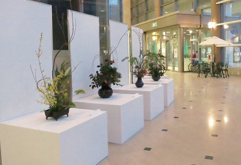
GEIBUN COLLECTION 2017 in OTAYA 大郷コレクション花器