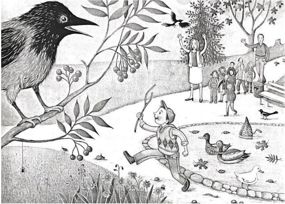
Kuva 1. Samuel riehaantuu Ankkapuistossa. Päiväkotiryhmän aikuiset näyttävät huolestuneelta. (Jansson ym., 2009a, 32).

Yllä olevassa Hauska matka eskariin! -materiaalin esimerkissä Samuel käyttäytyy ylivilkkaasti verrattuna muihin päiväkotiryhmän lapsiin, jotka kävelevät parijonossa ryhmän opettajien kanssa. Tämä tulee ilmi tarinassa, jota tarinaan liittyvä kuva myös tukee. Samuel joutuu tarinassa jopa vaaralliseksi kuvailtavaan tilanteeseen, koska hän riehaantuu ja juoksentelee puistossa kiinnittämättä huomiota ympärillä tapahtuviin asioihin. Hän myös itse tiedostaa, että hänen toimintansa ei ollut toivottua. Paheksumista tuo esille myös esimerkiksi se, että tarinassa toisen opettajan sanotaan puistelevan päätään Samuelille. Kuvassa aikuiset näyttävät huolestuneilta, mutta Samuelilla itsellään vaikuttaisi olevan hauskaa.