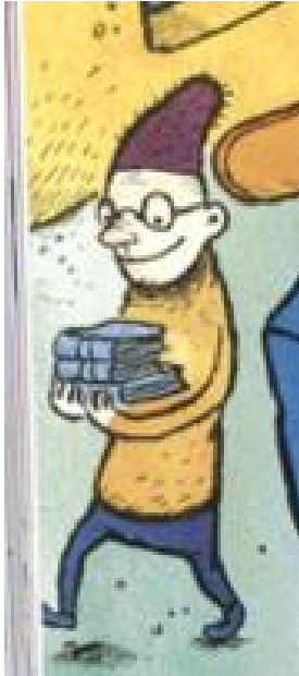
Kuva 6. Taustalla oleva aikuinen hahmo kirpputorilla (Jansson ym., 2012b, 76).

Seikkailujen eskari -materiaalin Mio-hiiri on eskariryhmän ainoa hahmo, jolla on silmälasit. Kummaa-materiaalin päähahmon Tiksun ylle kuvattiin myös lasit, mutta hahmokuvaussessa tuli ilmi, ettei Tiksu käytä silmälaseja vaan suojalaseja. Tiksusta ei siis voi varmasti sanoa hänen olevan heikkonäköinen, vaikka lasit siihen viittaisivatkin.