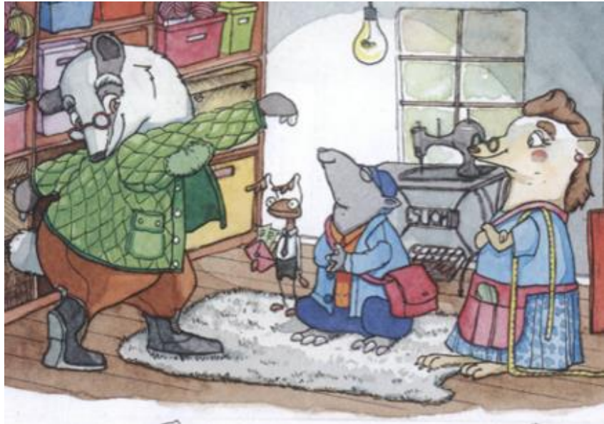
Kuva 7. Sivuhahmot Tellervo Tuhinan ompelimossa (Lassila ym., 2017b, 28).

Seikkailujen eskari -materiaalissa esimerkiksi Tellervo Tuhinan ompelimossa (kuva 7.) esitettiin Tellervon ja presidentin päällä silmälasit. Kummatkin näistä heikkonäköisistä hahmoista ovat siis aikuisia sivuhahmoja. Taikamaan esiopetus -materiaalissa esitettiin esimerkiksi kirpputorilla olevan aikuisen hahmon päällä silmälasit (kuva 6.). Kuvassa 8. ei esiinny silmälaseja, mutta tulkintamme mukaan kuvan silmiä siristelevä myyrä on heikkonäköinen, kuten myyrät yleensäkin ovat.