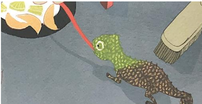
Kuva 11. Kamu nappaa hedelmiä pitkällä kielellään. Kamu osaa kameleonttina vaihtaa väriään. (Wäre ym., 2017c, 62)

“He löysivät monta sivua, joilla kerrottiin kameleonteista. Ne olivatkin hyvin erikoisia otuksia. Ne osasivat vaihtaa väriä ... Kameleontti silmät saattoivat yhtä aikaa katsoa eri suuntiin, toinen eteen ja toinen taakse tai ylös ja alas ... Kieli oli usein pidempi kuin koko otus.” (Wäre ym., 2017b, 39)