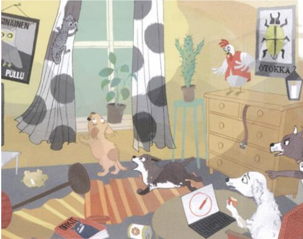
Kuva 2. Vinku ja Vonku riehuvat Aimon talossa ja muut katsovat tilannetta paheksuen ja huolestuneesti. (Wäre ym, 2017c, 66).

– Sen kyllä huomaa, Reetu sanoi. - Aika vähän teillä on tapoja.” (Wäre ym., 2017b, 62).