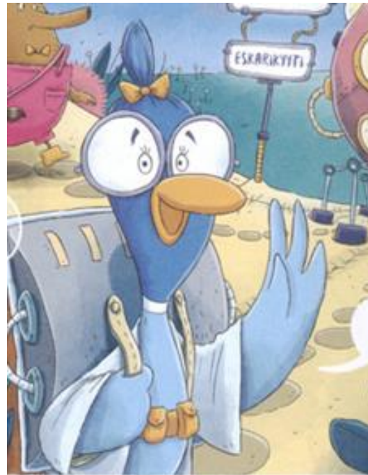
Kuva 5. Tiksu. (Gunn ym., 2019b, 4).