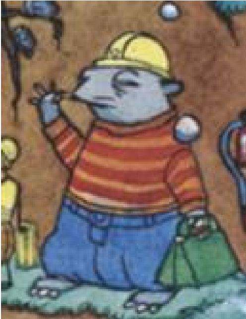
Kuva 8. Seikkalujen eskari -materiaalin heikkonäköinen myyrä sivuhahmo. (Lassila ym. 2017b, 19).

Puheenkehitys tuli aineistossa ilmi selkeästi Huiske esiopetus -materiaalin päähahmo Apulin kohdalla äännevirheenä. Apulilla on r-vika, joka tulee realistisesti esille useammassa materiaalin tarinassa hänen puhuessaan.