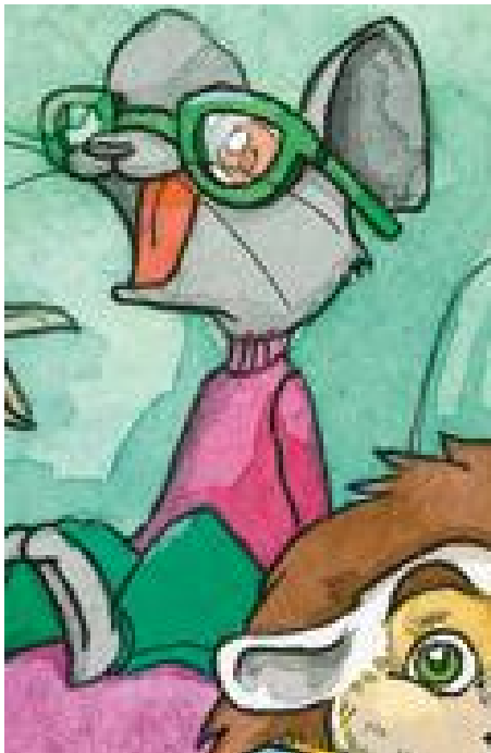
Kuva 4. Mio. (Lassila ym., 2017b, 4).

Heikkonäköisyyttä kuvattiin materiaalien kuvissa silmälaseilla. Heikkonäköisiä hahmoja kuvattiin melkein jokaisessa materiaalissa. Silmälaseja kuvattiin yleensä aikuiseksi tai vanhukseksi tarkoitetun sivuhahmon tai taustalla olevan hahmon päällä (esimerkiksi kuvat. 6. ja 7.). Tästä huomiosta kuitenkin poikkesivat esimerkiksi Mio ja Tiksu (kuvat 4. ja 5.), jotka ovat lapsia ja päähahmoja. Joka tapauksessa lasten yllä silmälaseja kuvattiin huomattavan paljon vähemmän kuin aikuisten päällä. Tämä voi luoda kuvaa siitä, että heikkonäköisyys on pääasiassa aikuisten ihmisten vamma. Silmälaseja tai heikkonäköisyyttä ei mainittu tarinoissa ollenkaan, vaan ne näkyivät pelkästään kuvissa.