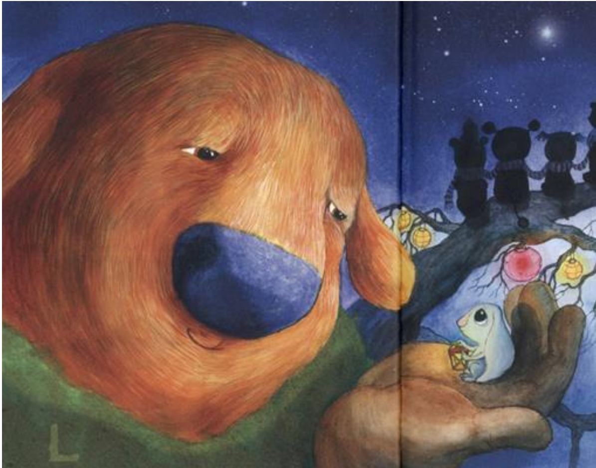
Kuva 10. Rauhio pitelee Nuuteloä kädessään. (Kirkkopelto ym. 2016b, 28–29).

olivat muut Taikamaan esiopetuksen päähahmot. Ompun muita suurempi koko tuli ilmi esimerkiksi materiaalin tarinassa, jossa muut hahmot eivät jaksaneet vetää kärkeä, jossa talviunilla oleva Omppu nukkui.