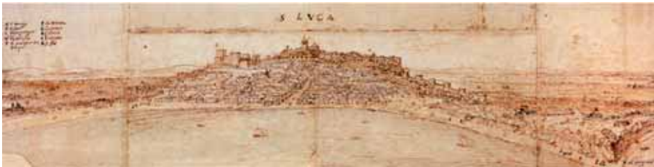
Fig. 4. Vista de Sanlúcar en 1567, por Anton Van den Wyngaerde.