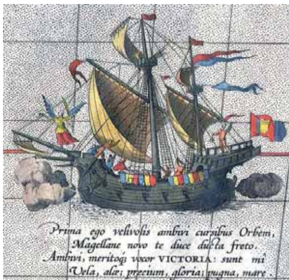
Fig. 1. Nao del siglo XVI.

Siguiendo a Sandoval, vemos que en 1537 se le enviaba con cuatro navíos 16 de la guarda de la costa de Andalucía a reforzar la flota de Blasco Núñez Vela, ante la amenaza de la numerosa armada que los franceses pensaban enviar a las Indias [1]. El documento que debió manejar Sandoval es la carta que el emperador envía a Blasco Núñez Vela, fechada en Monzón el 4 de septiembre en la que le comunica, entre otras consideraciones, que le envía como refuerzo la escuadra que se había aderezado para la guarda de la costa, ante el aviso que en Bretaña se estaban aderezando cinco navíos gruesos y se aparejaban otros ocho, “que son por todos trece”, con la intención de embarcar tres mil hombres y dirigirse a La Habana, y de allí a Nombre de Dios y costa de Tierra Firme con el propósito de saquear sus ciudades 17 . En referencia a Perea le indicaba: