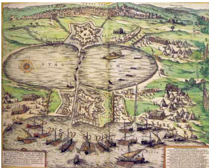
Fig. 6. La plaza de la Goleta en 1535.

Perea llega a Melilla un tormentoso día de marzo de 1549 74 con la misión de finalizar los trabajos de configuración del Primer Recinto 75 , acometiendo enseguida las tareas de “ahondar la cava y terraplenar en donde ay mayor necesidad” 76 , obra que tienen completada apenas cuatro meses después, “porque no paramos fiestas ni difuntos” 77 , cuando se suben cuatro piezas de artillería al nuevo muro y terraplenado que habían hecho, continuándose