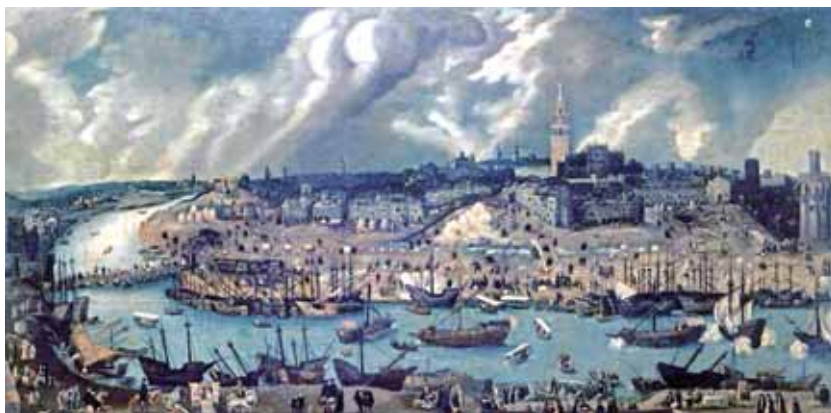
Fig. 2. Puerto de Sevilla a mitad del siglo XVI.