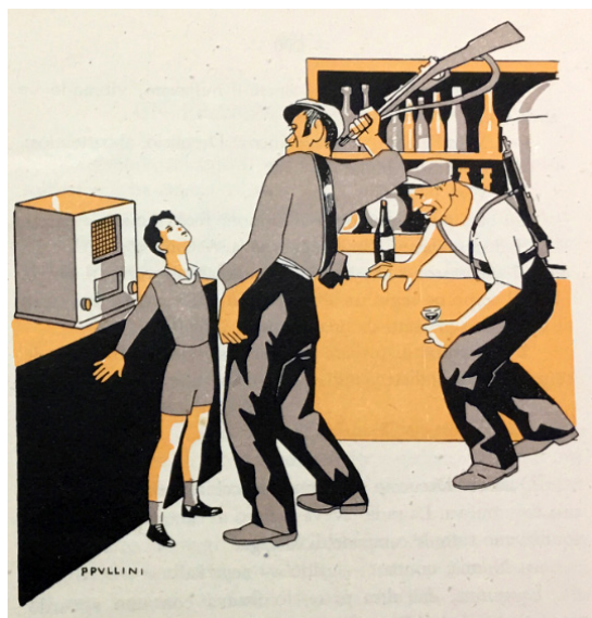
Imagen 1. Ilustración del cuento Le campane di Malaga . 38

La historia, una vez muerta la madre, se focaliza en otro personaje femenino: la abuela. Aquellos hombres que frecuentaban la tienda de Dreuccio aparecen nuevamente en la historia y ponen en peligro la vida de la nonna , acompañándolo de imágenes que contribuían a profundizar en el miedo a los milicianos republicanos. Como se puede observar en la ilustración (imagen 1), el joven italiano se interpone para defender a su abuela, lo cual le pone en peligro. En la imagen se puede observar cómo eran hombres de gran constitución. Uno de ellos bebía y animaba al otro, que, colocado frente al joven italiano, se disponía a propinarle un golpe con una escopeta. Esta ilustración resulta destacable por la crueldad, victimización, y sobre todo, por la desproporción física de los varones respecto al niño.