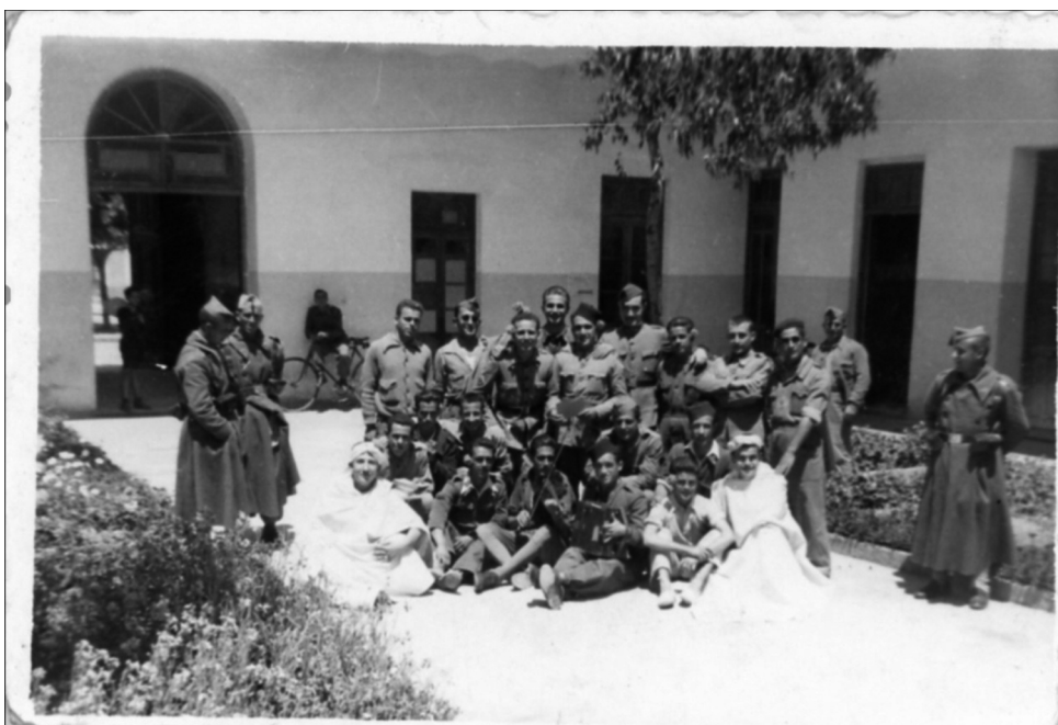
Falangistas en el Colegio Hebreo de Melilla tras la incautación