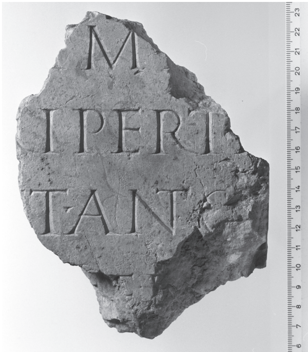
Abb. 1: Inschriftfragment AE 2001, 1518.

Die kleinen Buchstaben von 2,3 (Z. 1) bis 2,2 (Z. 2-3) cm zeigen eine sehr qualitätsvolle Ausführung mit einer Ligatur in Z. 3 (NT), dem etwas über die Zeile ragenden T in Z. 2 sowie dem dreieckigen Interpunktionszeichen in Z. 3. Der Stein wird heute im Depot von Site et Musée romains d'Avenches (Inv. Nr. 7196) aufbewahrt. Eine Autopsie wurde im Jahr 2010 durchgeführt 2 .