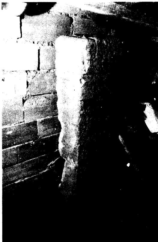
Lámina 1. Fotografía general del ara centrada especialmente en las características del soporte.

La decoración del zócalo y la cornisa es formalmente idéntica: una faja cóncava de 9 y 12 cm respectivamente. En ambos casos, la moldura sólo sobresale 2 cm de la superficie del campo epigráfico. La única diferencia es que entre la peana y el zócalo hay una media caña cóncava y entre la cornisa y el coronamiento un bisel inverso (lámina 1).