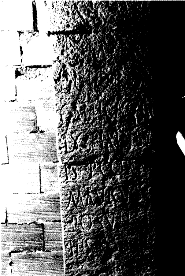
Lámina 3. Texto epigráfico.