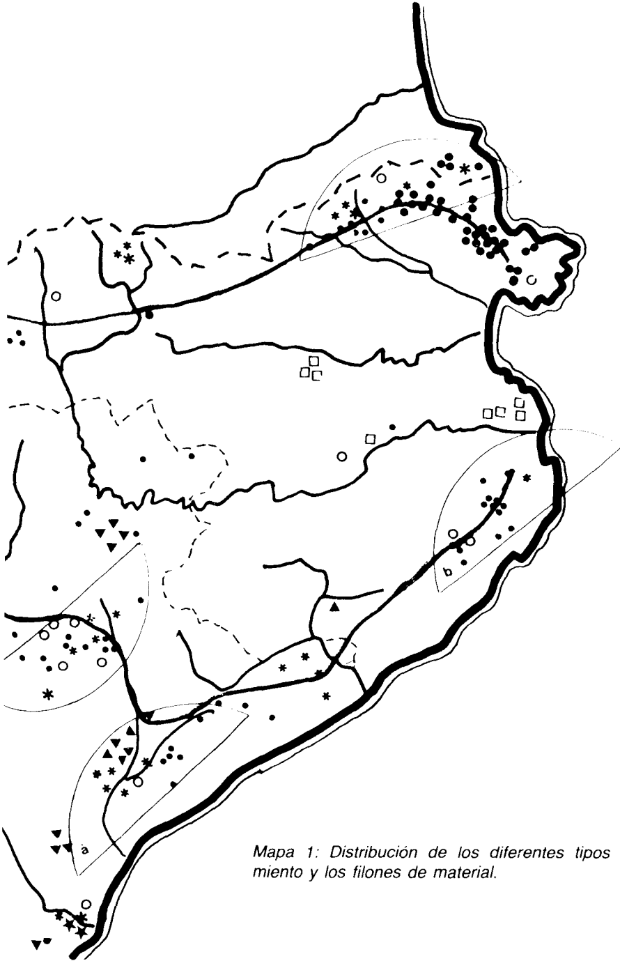
Mapa 1: Distribución de los diferentes tipos de enterramiento y los filones de material.