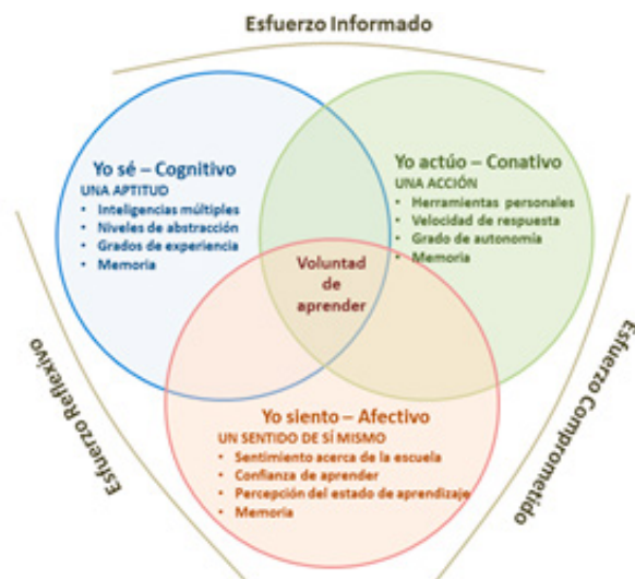
Figura 1. Procesos mentales que operan en los patrones de aprendizaje

Adaptado de “Intentional teaching: The let me learn® classroom in action”, por Dawkins et al., 2010.