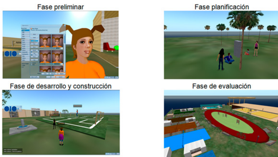
Figura 2. Trabajo colaborativo de los participantes en las distintas fases de la actividad formativa

Los participantes en las distintas fases desarrollaron algunas acciones en busca de alcanzar las metas planteadas en la actividad pedagógica (figura 2).