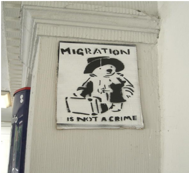
Figura 2. Grafiti callejero con la imagen del icono cinematográfico Oso Paddington , bajo el slogan “la migración no es un crimen,” April 2009 Lünen, Germany, Foto: mkorsakov. Flickr (CC BY-NC-SA 2.0)

Como punto de inflexión en esta presentación, analizamos el contexto histórico donde se planteó la interpretación de la migración con la lente de la autonomía. La autonomía de las migraciones constituye un cambio analítico innovador para conceptualizar la relación entre las vidas en movimiento y las prácticas de gestión migratoria. Es decir, la Autonomía de la Migración representa un giro relevante en los estudios migratorios clásicos descentrando el enfoque convencional: en vez de concentrarse en las “razones que explican las migraciones” o en “los controles migratorios” per se , el punto de interés se centra en la compleja