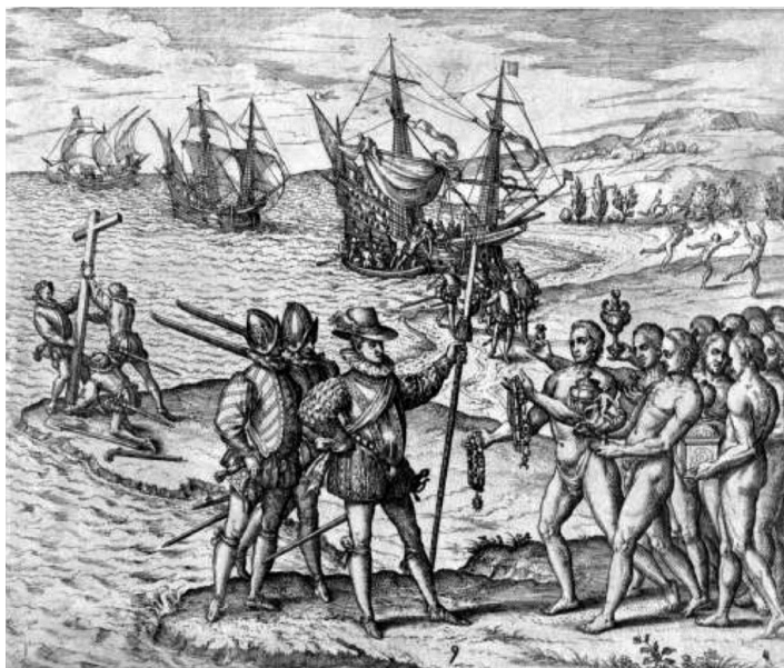
Figura 2. Obra de T. de Bry: «Desembarco de Colón en Guanahani». Grabado, 1594

Sin embargo, en este último caso las actividades formuladas sobre la imagen se centran en aspectos superficiales como la descripción de la escena, los personajes o el número de naves que empleó Colón en su primer viaje. Este nos parece un buen ejemplo para ilustrar la forma en que se puede hacer un mal uso de un recurso como este, entre otros motivos, porque no invita a realizar un análisis crítico del contenido claramente colonialista que representa la escena. Además, también pasa por alto elementos muy significativos como la postura de los personajes, las armas y el aspecto de los conquistadores como representación de poder, los personajes que se encuentran en segundo plano alzando una cruz y su simbolismo como expansión del cristianismo, o la propia autoría de la escena y los sesgos que pueden haber influido en la representación. Ignorar todos estos aspectos de la imagen y formular simplemente cuestiones de carácter descriptivo puede llevar al alumnado a naturalizar escenas como esta o simplemente a no cuestionarlas.