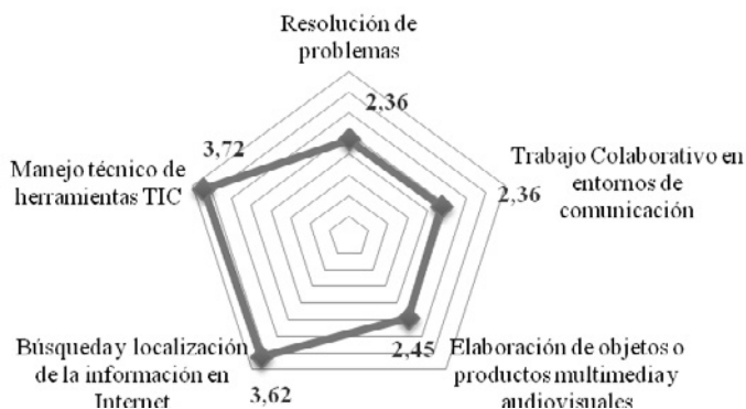
Figura 2. Perfil competencial del alumnado ante las TIC

◆ Media del profesorado sobre la percepción de la habilidad digital de su alumnado