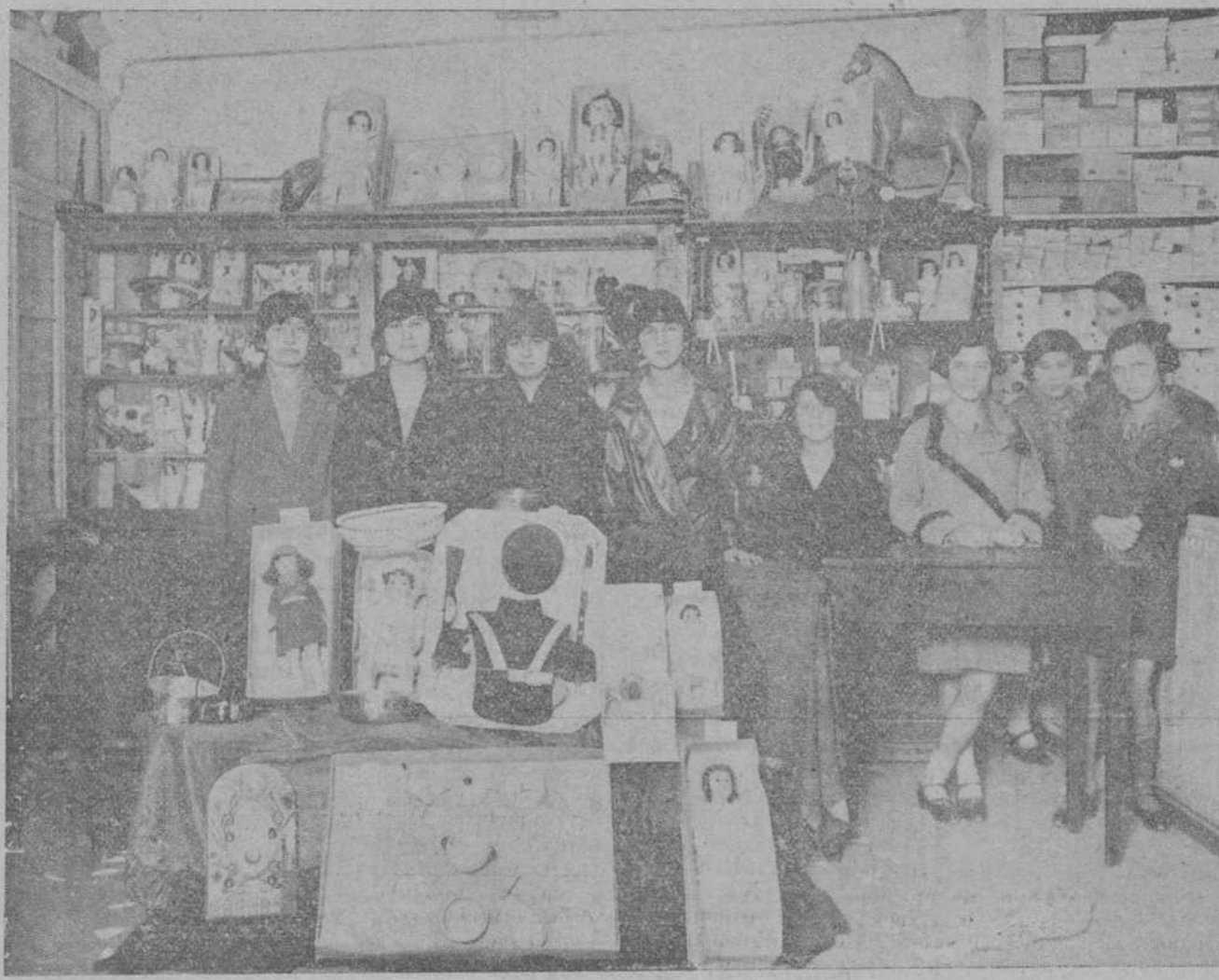
La tómbola a beneficio de los niños pobres de la Catequesis del Sagrado Corazón.