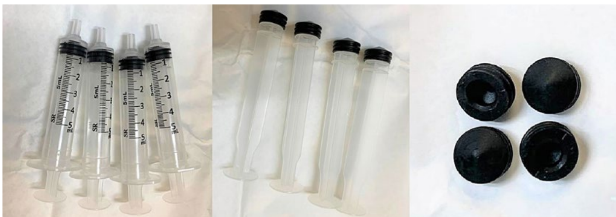
Figura 1 - Êmbolos de borracha de seringas de 5 mL para utilizar como brincos de pressão durante o acto cirúrgico

A utilização de pressão após excisão de quelóide para ser efetiva deve ser de aproximadamente 20-40 mmHg e o mecanismo de ação subjacente a técnica de compressão se baseia na redução da perfusão, diminuição do oxigênio no local, redução da síntese de colágeno e degradação dos fibroblastos. 5,10,11 Nos casos aqui relatados, foi utilizada a técnica de pressão contínua por meio de êmbolos estéreis de seringas de 5 mL por serem de fácil acesso e reprodutíveis no momento do ato cirúrgico, além de boa aparência