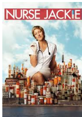
Figure 1. Jackie et les « benzos »