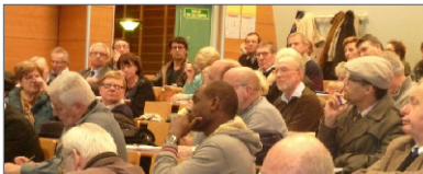
Rencontre avec le public sur le thème de l'identité normande, Rouen, 12 décembre 2014