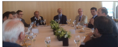
Déjeuner de travail avec le maire du Havre, 11 juin 2015

Dans ce nouveau contexte, outre la préparation des bulletins sur la métropole normande (figure 5), l'animation de rencontres publiques et l'organisation d'un colloque scientifique