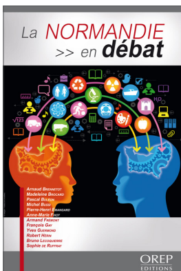
Figure 2. La Normandie en débat , OREP, Bayeux, 2012

La publication de cet ouvrage a eu un écho contrasté. Hormis quelques cas isolés, les responsables institutionnels interpellés ont peu réagi. Cette indifférence politique a largement résulté de l'hostilité de certains leaders socialistes haut-normands d'alors vis-à-vis de toute fusion des deux régions normandes, alors même que cette perspective était mieux accueillie en Basse-Normandie. Cet ouvrage a néanmoins permis de faire connaître les idées développées au sein du collectif, de nouer des contacts et d'engager un dialogue avec divers acteurs du territoire régional, notamment par le biais de réponses à invitations : réunions d'associations citoyennes, tribunes libres dans la presse régionale, réponses à interviews, cafés géographiques, etc. La présentation de l'ouvrage, proche du format académique, n'a cependant pas permis de toucher un large public.