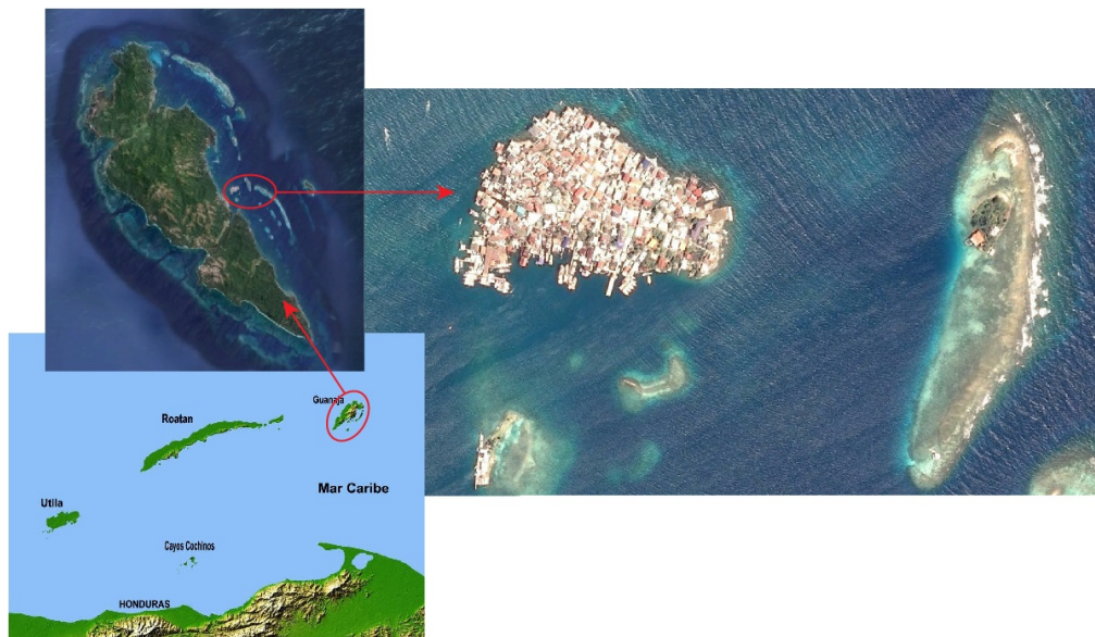
Figure 1. Des îles, entre méconnaissance et oubli : l'exemple de Cay Pond (îles de la Baie, Honduras)