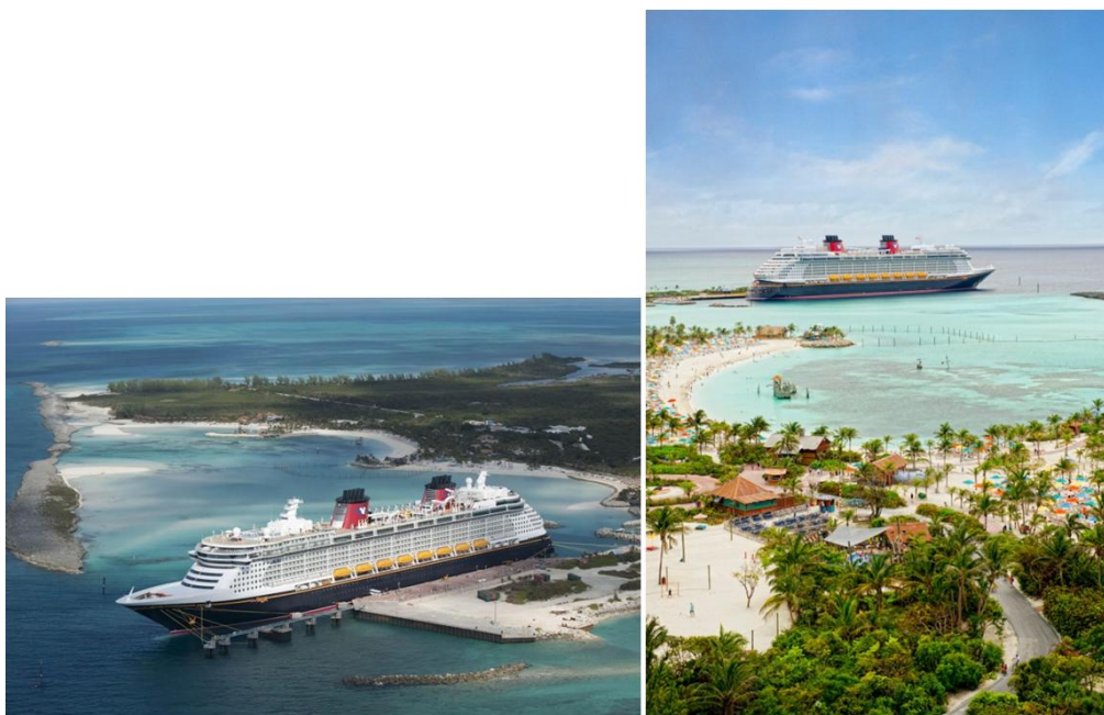
Photographies 3a et 3b. L'île privée de Castaway (Bahamas) réservée aux clients de Disney Cruise Line.