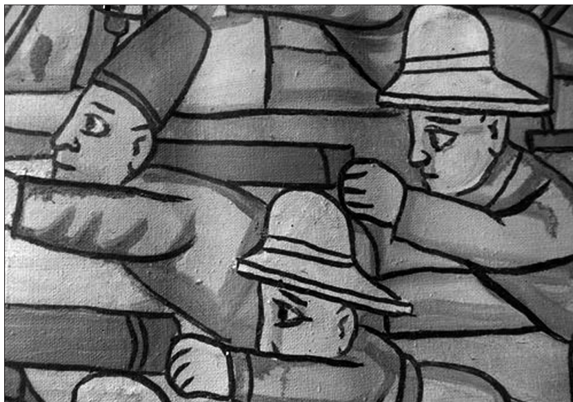
Ill. 1. – Ascari érythréens aux côtés de soldats italiens dans la bataille d'Adwa (Détail d'une fresque du peintre Berhanou, 1989).

amertume côté éthiopien. Les représentations de la guerre d'Éthiopie sont des frontières de « chair » d'une puissance évocatrice inégalée dans l'imaginaire abyssin... Si deux images pouvaient symboliser deux moments historiques particulièrement marquants, Adwa et la marche sur Addis-Abeba demeureraient les référents forts du XX e siècle d'un point de vue éthiopien ambara du haut plateau. Le peintre éthiopien Berhanou a d'ailleurs représenté ces deux moments militaires dans des fresques immenses. À Adwa, il a peint les soldats érythréens de profils parce que les « méchants » étaient toujours représentés de profils dans la peinture traditionnelle éthiopienne.