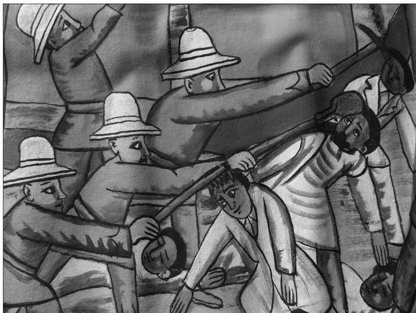
Ill. 2. – Exactions fascistes (Détail d'une fresque du peintre Berhanou, 1989).

Du point de vue éthiopien, ces couples mixtes inspirent un dégoût militaire, national et moral. Le comportement des ensablés est vu comme l'expression d'une avidité sexuelle pour les faccette nere .