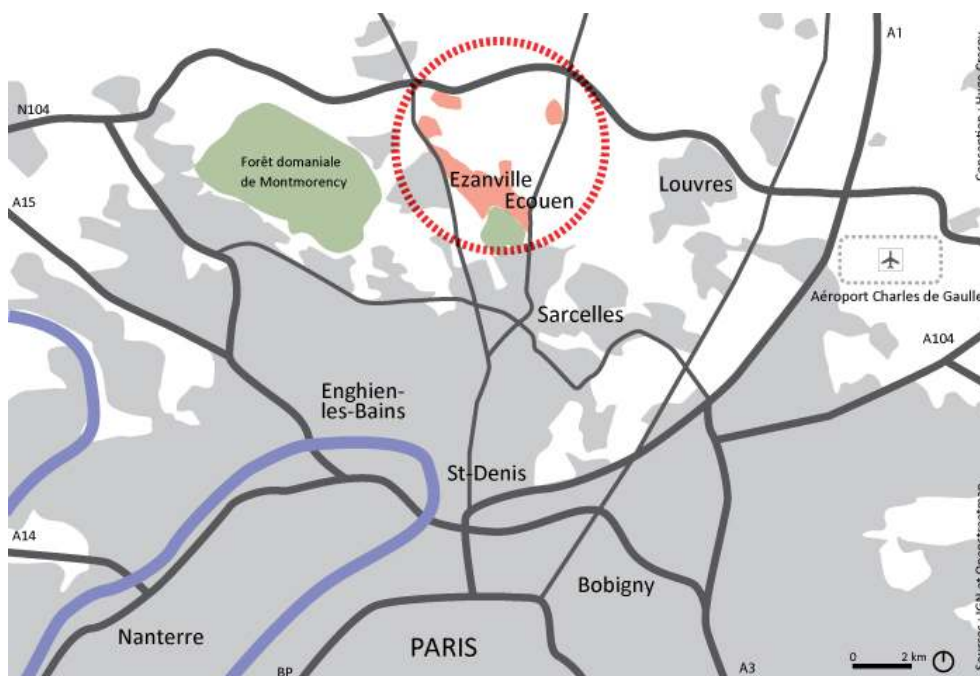
Figure 1 : Localisation du secteur d'étude, autour d'Écouen-Ézanville