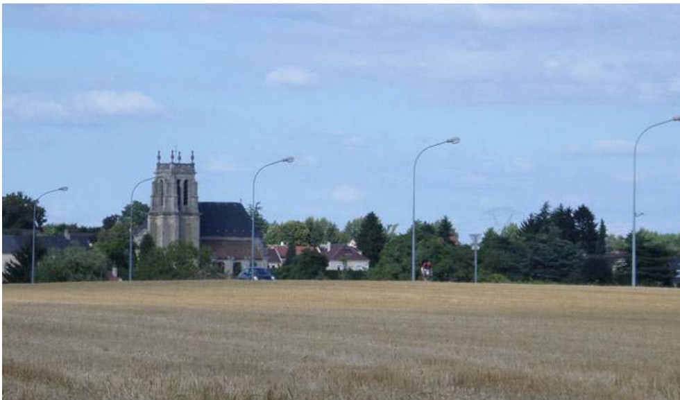
Figure 6 : Depuis Moisselles vers Attainville, une route éclairée pour les circulations piétonnières et cyclistes