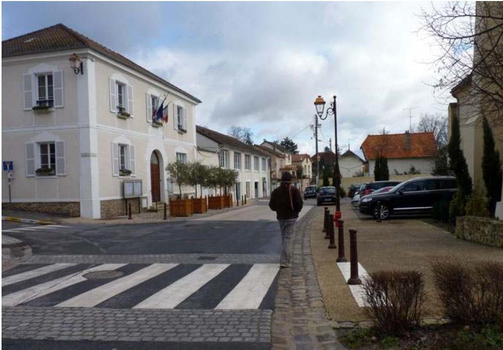
Figure 5 : Requalification et réduction de la place de l'automobile dans le centre de Moisselles