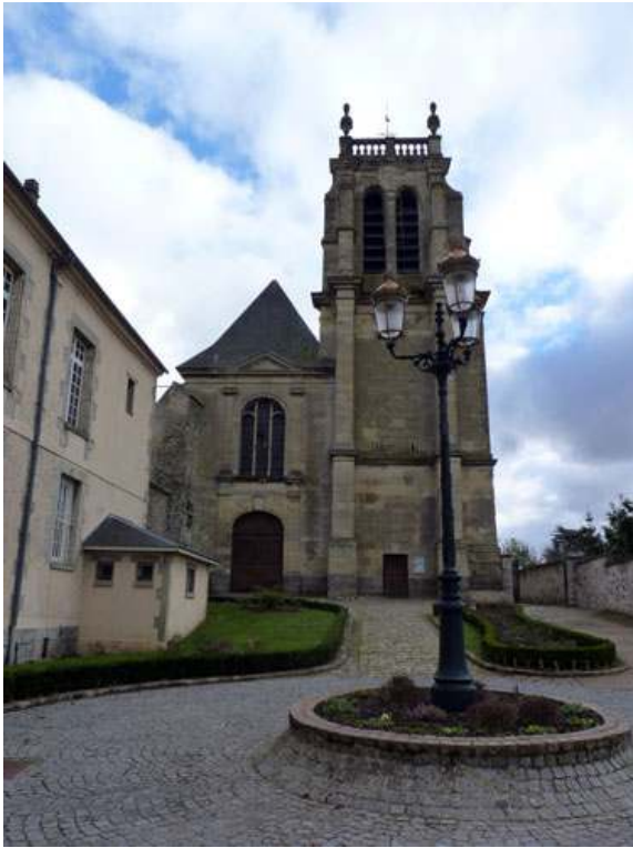
Figure 3 : Attainville, son église et ses lampadaires « Vieux Paris »