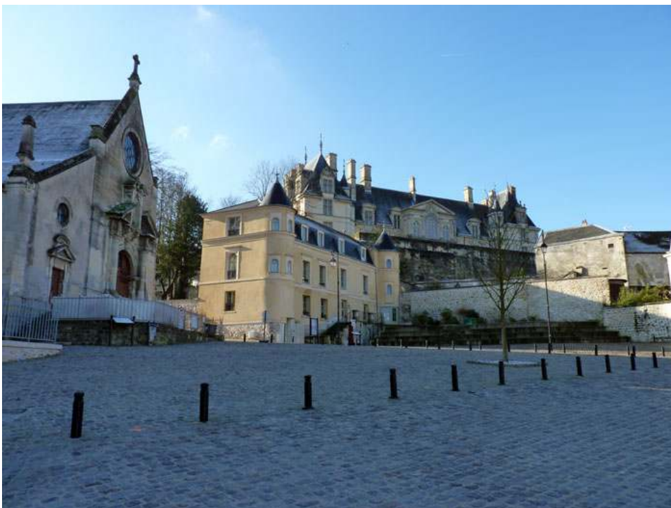
Figure 4 : Mise en valeur du patrimoine du centre ancien à Écouen

© Simon Labussière et Eugènia Viana, 8 février 2013