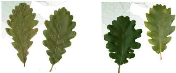
Figure 1: Similarité et diversité des caractéristiques morphologiques des feuilles: chêne sessile (à gauche) et le chêne pubescent (à droite)

Contour de la feuille. Nous pouvons noter que les classes comportent un nombre inégale d'individus, certaines espèces sont représentées par plus de 200 images, alors que d'autres en compte à peine 10. Enfin, la confusion des espèces à partir de leurs caractéristiques morphologiques est liée à la similarité inter-classe et la variabilité intra-classe [7]. Les 4 images pseudo-scans de la figure 1 proviennent de deux espèces (chêne sessile et chêne pubescent) et illustre bien cette confusion.