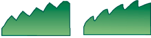
Figure 3 : La représentation de deux types de Contour de feuille: denté (à gauche) et denté en scie (à droite)

A cause de la confusion morphologique mentionnée ci-dessus, les valeurs de la première sortie des sous-classifieurs RF_i ne correspondent pas forcément aux propriétés réelles de la feuille. Dans ce cas, il est intéressant de considérer aussi la deuxième sortie pour reconnaître la feuille. Pour ce faire, une étape de raffinement basée sur la théorie de Dempster-Shafer a été implémentée, afin de déterminer quelle valeur de sortie nous devons prendre en compte. Cette étape de raffinement est schématisée dans la figure 4 et pour mieux l'expliquer elle est appliquée aux attributs du Contour de la feuille.