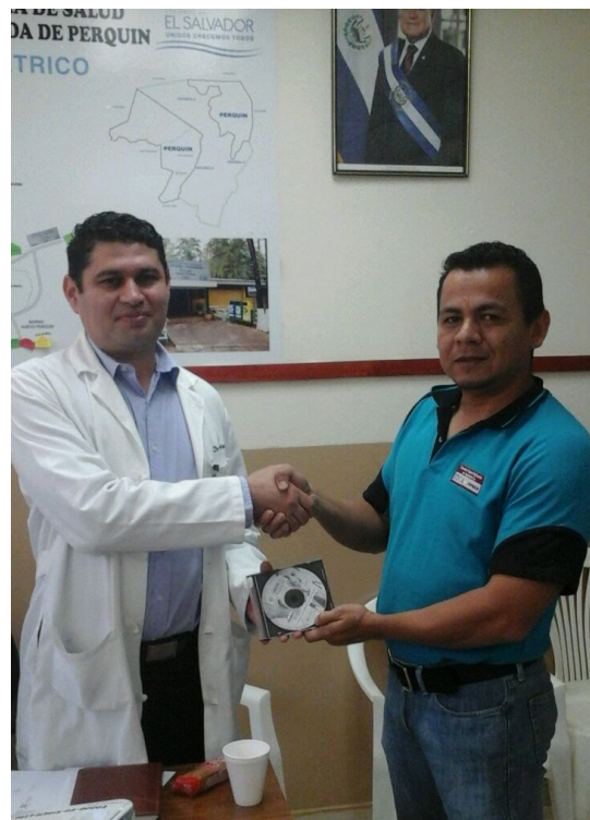
Entrega de Software a Director Unidad de Salud