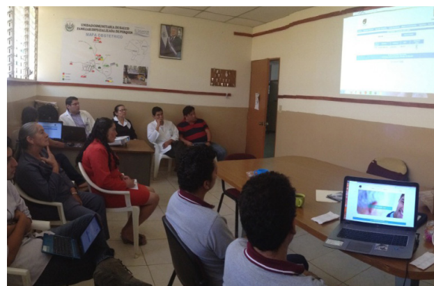
Presentación de Software en Unidad de Salud a docentes, estudiantes, Director y personal administrativo

Se programaron diez reuniones con el director y personal administrativo de la unidad de salud con el propósito de presentar los avances del sistema.