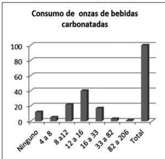
Figura No.1. Consumo de onzas de bebidas carbonatadas

Además se encontró que el 15.9% de los estudiantes consumían bebidas carbonatadas arriba de 16 onzas en cada sesión, lo que para los efectos del presente estudio, se catalogaron como altos consumidores, a pesar que el 64.1% consumían en rangos de 8 a 16 onzas diarias.