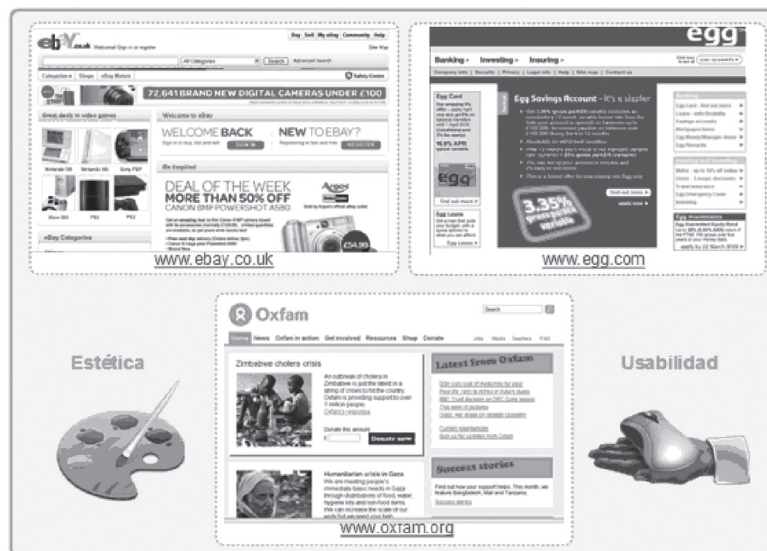
Figura 4. Usabilidad y Estética.

Se puede observar que aunque antes de empezar a navegar al usuario le producen mejor sensación las páginas más estéticas, finalmente es la navegabilidad, la usabilidad del sitio, la que marca la diferencia. Por ello, es necesario recurrir con prudencia a los conceptos básicos del diseño. Bien utilizados pueden ofrecer un importante valor añadido, ya que los usuarios valoran mejor el sitio gracias a la aportación derivada de la valoración psicológicamente positiva de la buena estética.